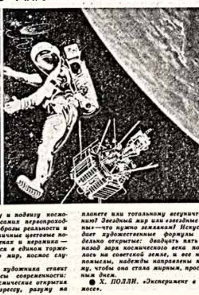
К 25-летию звездного полета Юрия Гагарина, в залу Дня космонавтики, в Центральном доме художника столица открывалась всеобщая выставка «Космос на службе мира».

Настоящее время проходит подготовку в СССР два кандидата в космонавты на Сирийской Арабской Республике. Достижения также доказательством о проведении второго советско-французского космического полета.