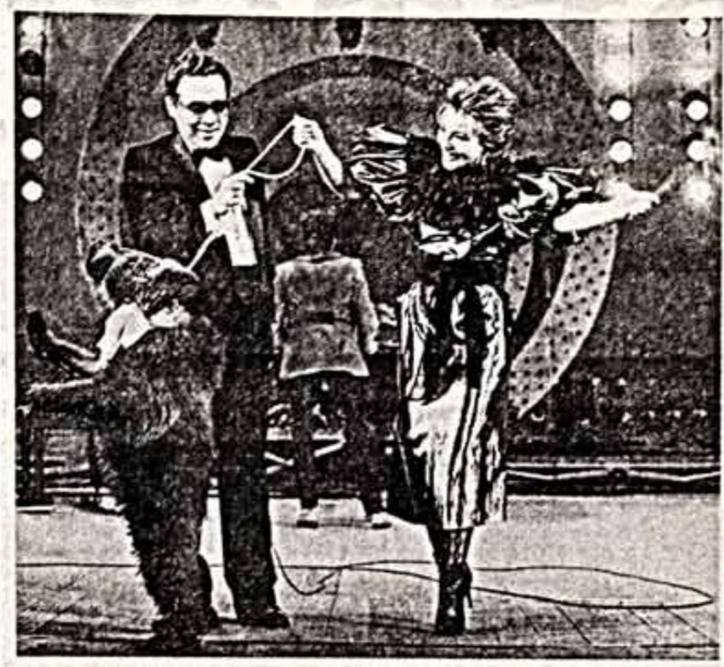
В гости к Кио