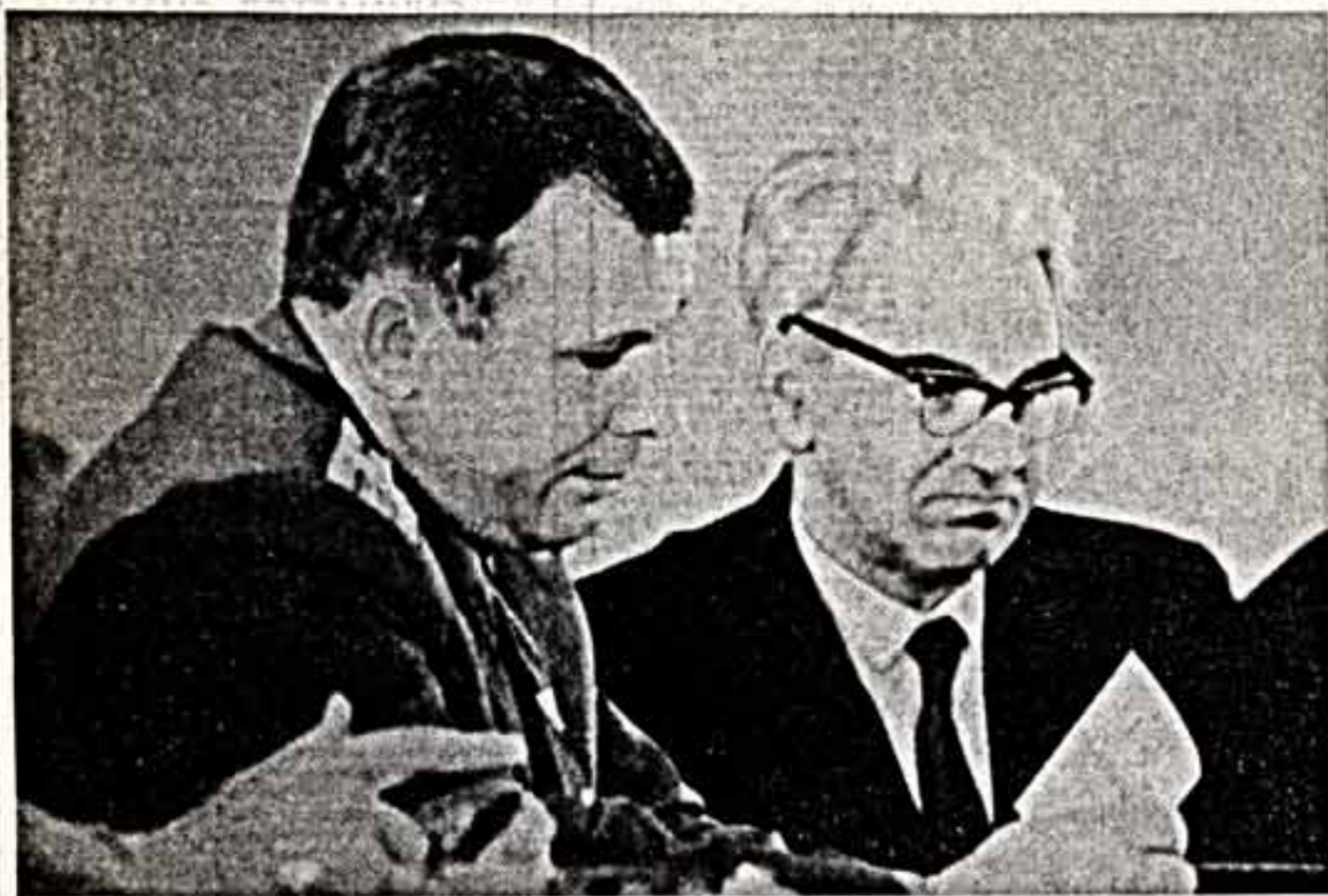
Ю. Гагарин и М. Келдыш на пресс-конференции в актовом зале МГУ имени М. В. Ломоносова, 1966 год.