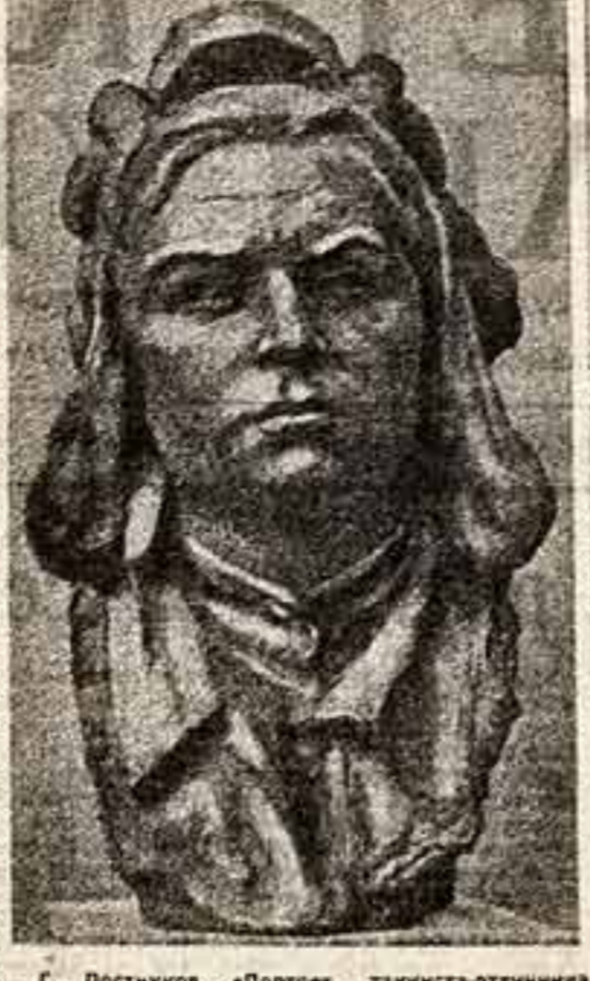
Е. Гоголева. «Портрет танкиста-блуждающего»