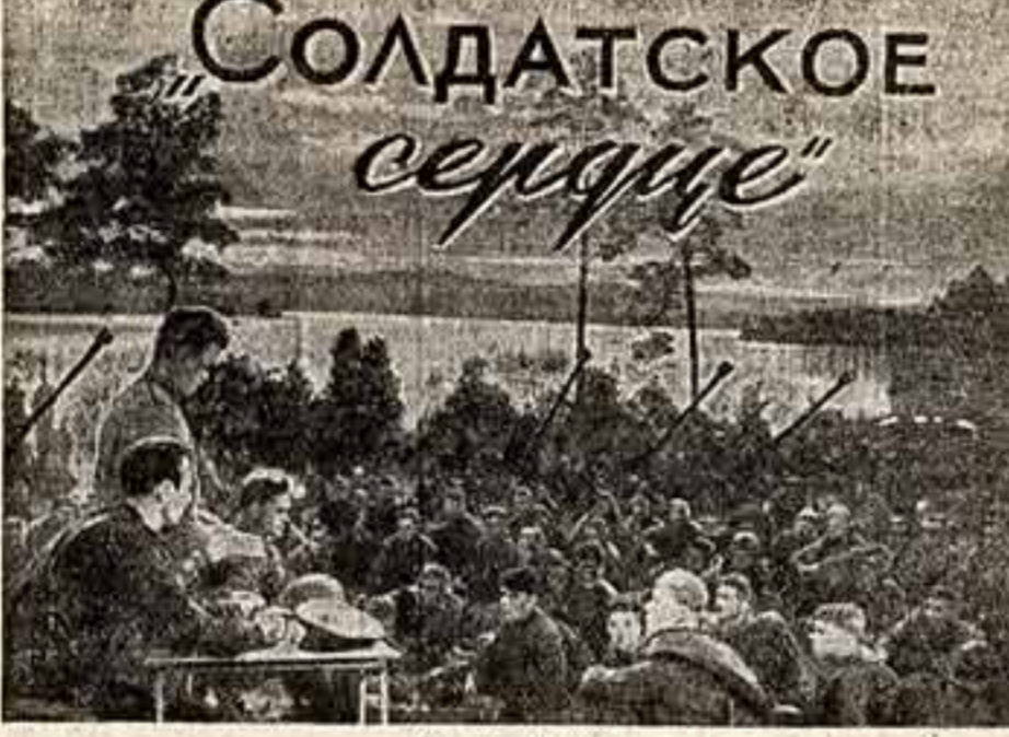
Надр из фильма.