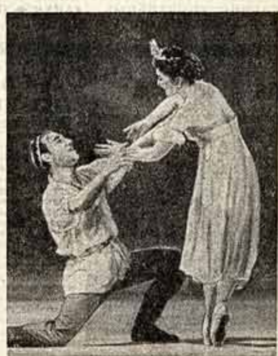
Балет «Мечты». Юлдуз — народная артистка Узбекской ССР Г. Имамбаева. Батир — артист А. Абдурахманов.

либретто, находить существенные изъяны в работе постановщиков узбекского балета «Мечты», но нельзя не подчиниться обаянию того народного начала, которое живет во всем строе спектакля, в музыке И. Акбарова, в массовых танцах. И особенно ярко это народное национальное начало раскрывается Галией Имамбаевой, танцующей партию Юлдуза. Только большой и умный мастер может с такой полнотой и силой передать в условных формах классического танца национальный стиль и характер Актриса выступает как подлинно национальный художник, верный традициям народного искусства.