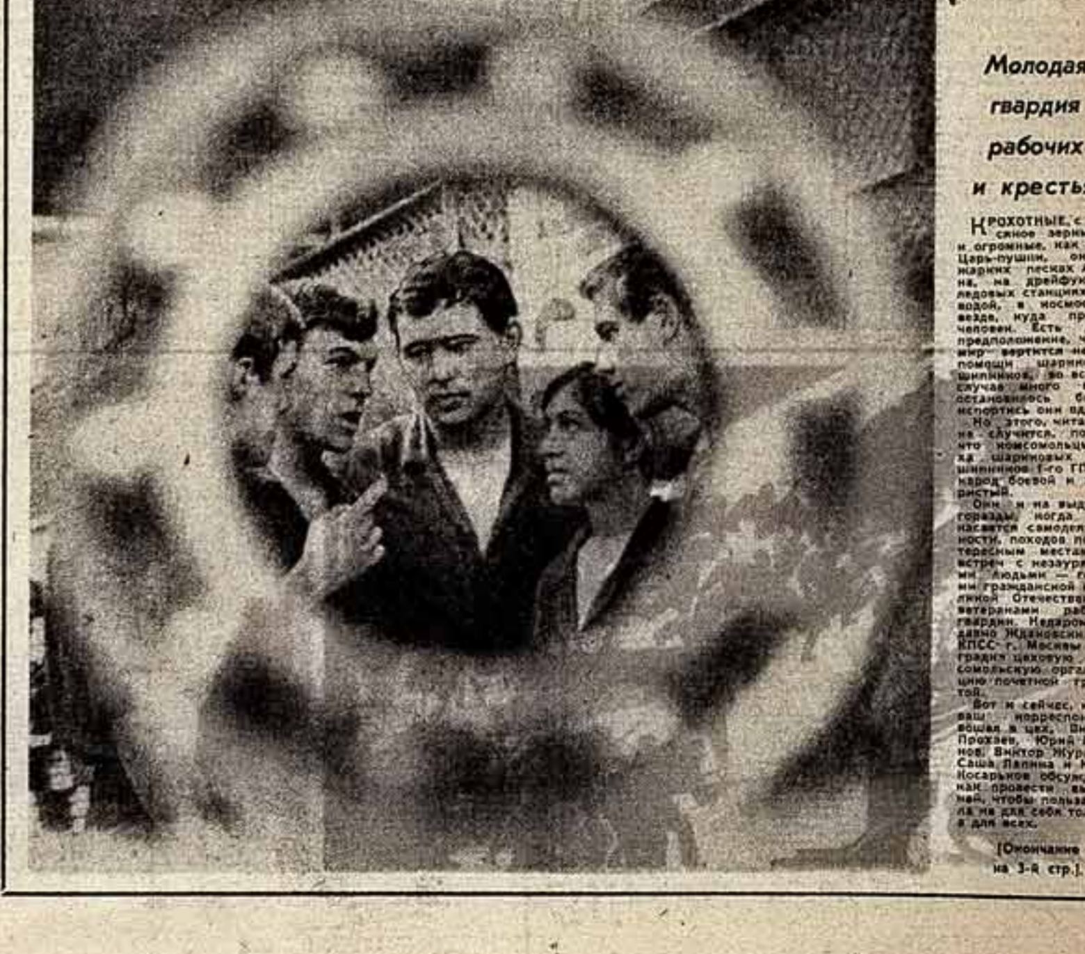
(Окончание на 3-й стр.)

Они и на выдумку гордыми, когда дело касается культуры, искусства, науки, техники, походов по интересным местам и странам, в музеи, в библиотеки, в кинозалы, в театры, в гости к героям гражданской и Великой Отечественной войн, к ветеранам войны и труда.