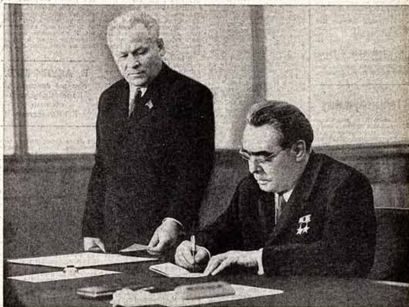
Партийный билет № 00000001 на имя Владимира Ильича Ленина, основателя Коммунистической партии, Советского государства, великого вождя трудящихся, подписывает Генеральный секретарь ЦК КПСС товарищ Л. И. Брежнев.

Партийный билет на имя Владимира Ильича Ленина передан на хранение в Институт марксизма-ленинизма при ЦК КПСС.