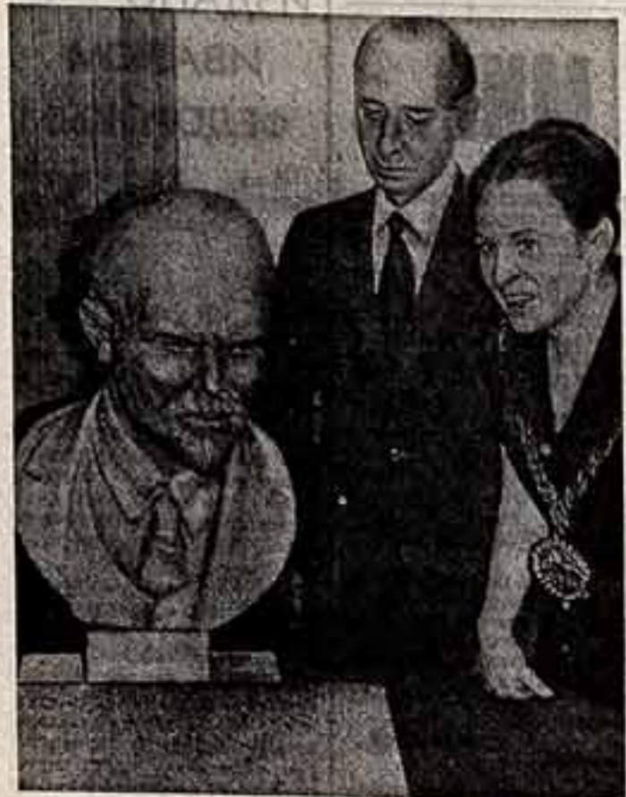
Лондонцы читают газету создателя Коммунистической партии Советского Союза, основателя Советского социалистического государства В. И. Ленина...

Во время войны Холфорд-сквер сильно пострадал от налетов фашистской авиации. Со времени начала коренной реконструкции площади в 1951 году памятник колодезю на тротуаре в местном муниципалитете.