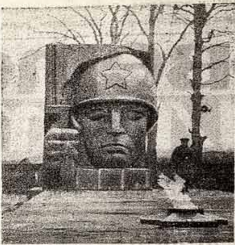
Коломна — город славных революционных, боевых и трудовых традиций. Коломенским героическим сражался в годы Великой Отечественной войны под Брестом и Севастополем, под Москвой и Ленинградом, под Сталинградом и Курском, штурмовал Берлин. Более 40 Героев Советского Союза дала коломенская земля. Более 14 тысяч коломенцев не вернулись с полей минавших сражений к своим родным очагам. Память о них священна.

И. СОЛОДАРЬ, председатель совета по репертуару художественной самодеятельности при Министерстве культуры СССР.