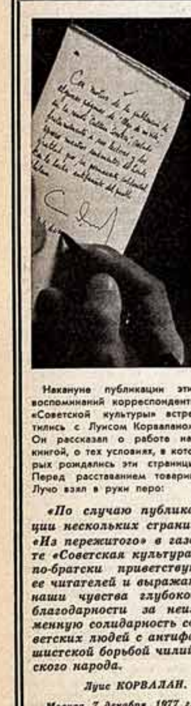
Луис КОРВАЛАН. Москва, 7 декабря 1977 г.