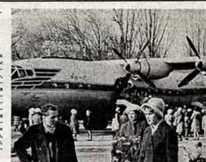
В одном из парков Крыжого Рога установлен отслуживший срок, списанный самолет АН-10. В «звонкой» жизни самолет стал кинотеатром «Орленок», его салон переоборудован в зрительный зал на 70 мест. В кабине самолета размещался маленький музей авиации, где дети знакомятся с основами отечественных самолетов.

Двадцать дней в театры и концертные залы столицы проходил традиционный фестиваль искусств «Русская зима», который завершил смотр творчества народов СССР. Вчера шесть тысяч москвичей и гостей столицы собрались в Кремлевском Дворце съездов, чтобы проводить праздник. На состоявшемся здесь заключительном концерте выступили артисты московских театров, послы из Франции, Молдавии, Литвы, других братских республик.