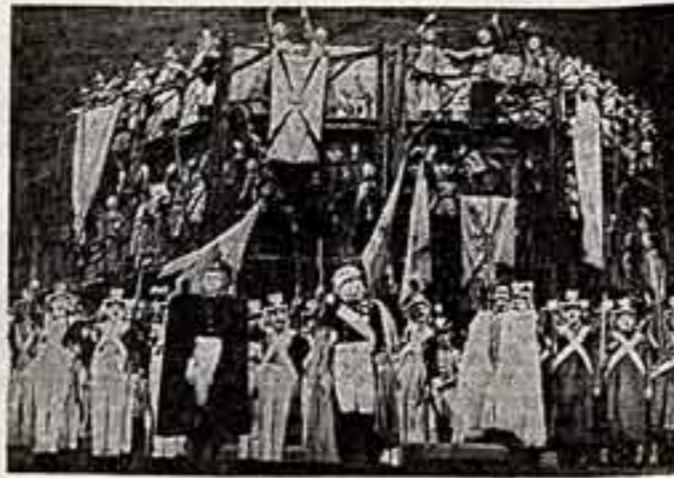
Заключительная сцена спектакля.

Опера «Воина и мир» в Театре имени С. М. Кирова