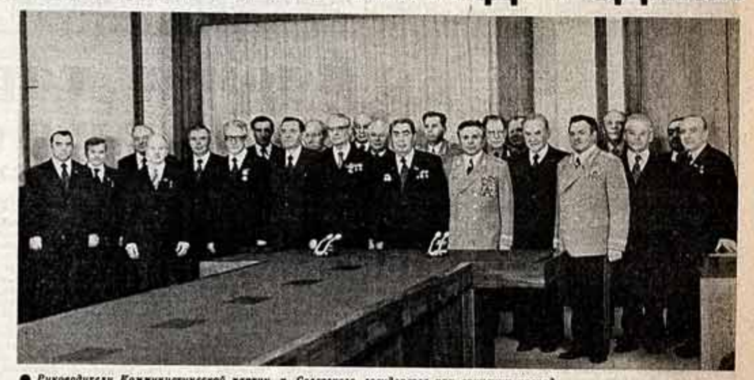
Руководители Коммунистической партии и Советского государства при вручении наград.

Под руководством возглавляемого Вами, Шариф Рашидовича, Центральным Комитетом Компартии республик коммунисты и все трудящиеся Узбекистана достигли значительных успехов в деле выполнения решений XXV съезда партии, в борьбе за боль-