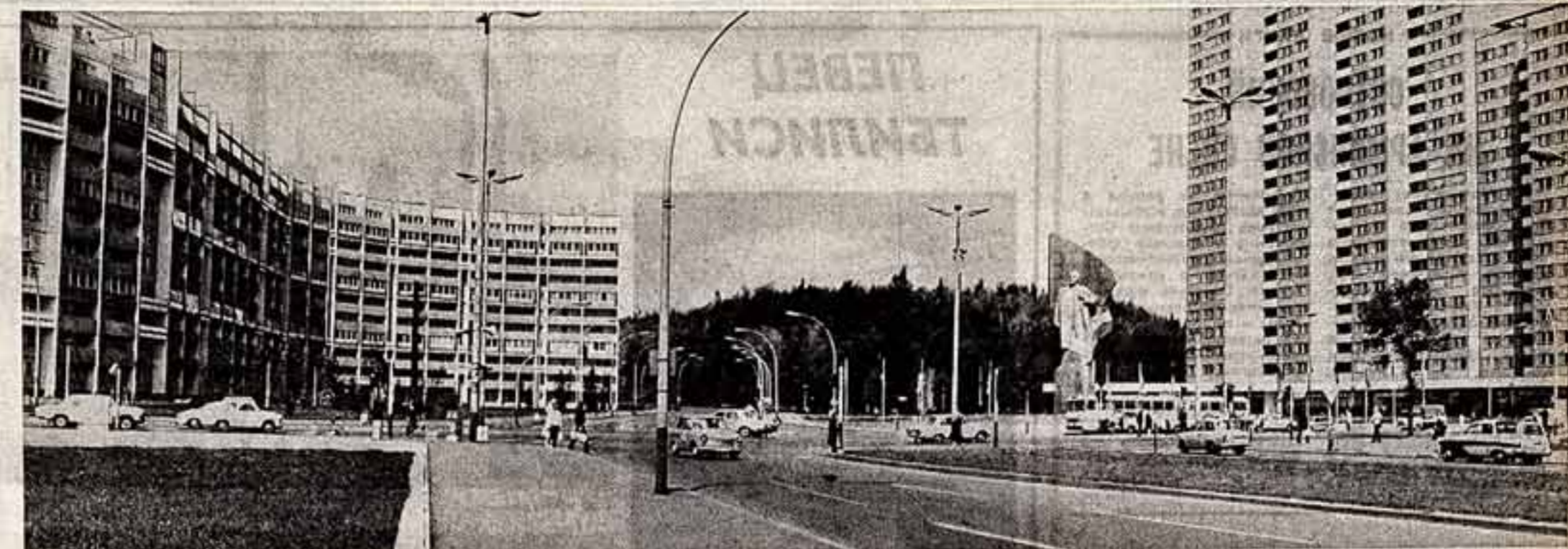
Ниж Владимир Ильич Ленин носит одна из новых и красивых площадей столицы ГДР Берлина, обрамленных многоэтажными корпусами современных зданий. В центре ее возмещается памятник вождю международного пролетариата, основателю Советского государства.

Мои друзья, чилийские кинематографы, в эти дни держали камеру в руках, как оружие против фашизма. Так же, как много лет назад держали ее операторы в Каса-дель-Камо, как держали ее мои товарищи в Сталинграде, создавая