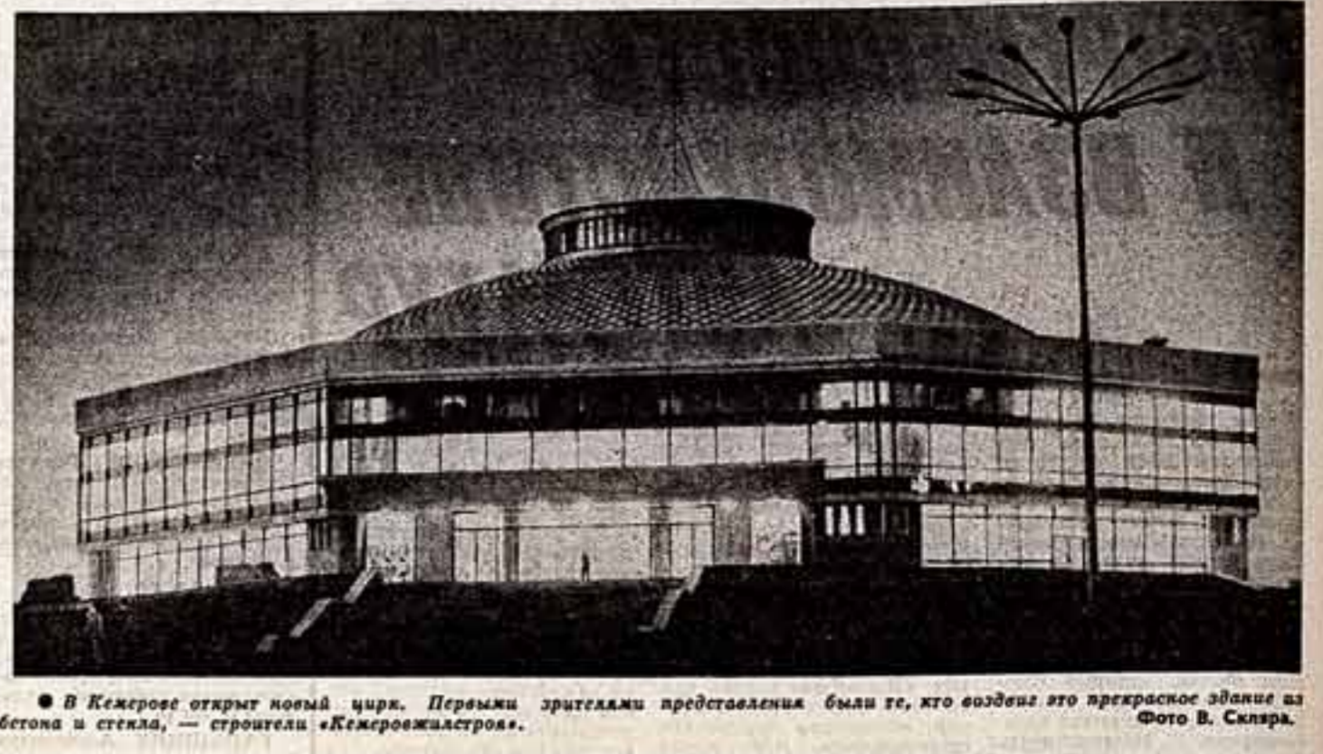
В Кемерово открыт новый цирк. Первыми зрителями представления были те, кто воздвиг это прекрасное здание из бетона и стекла, — строители «Кемеровоалстроя».