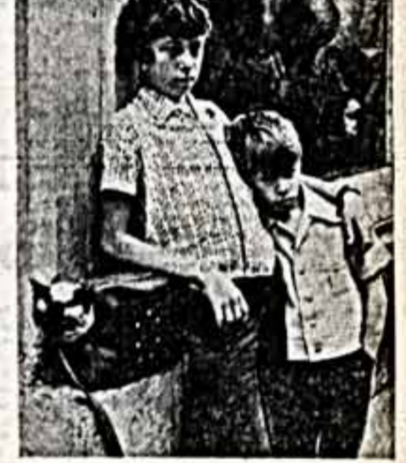
В этих рядах общественной работы корреспондент ансамбля села Атауллинского, они прислали своего замечательного дублика. Ю. ЗОТИКОВ.

А на самом деле такое положение — дань старой дурной традиции, безответственности идеологически традиционных хозяйственных руководителей.