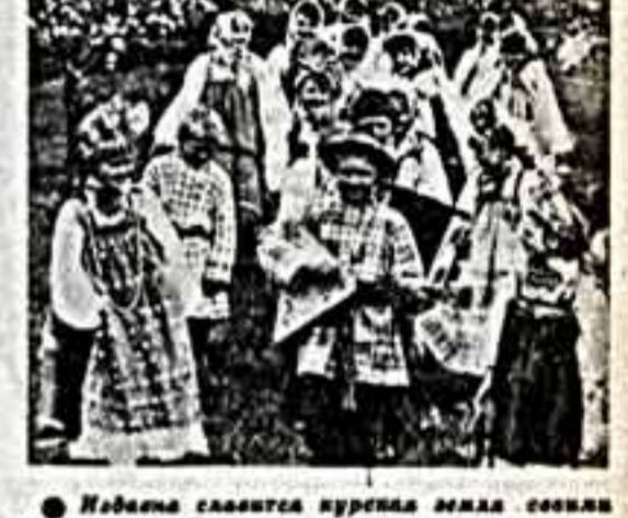
Молодая семья живет в поселке Ленинского района. Большая семья успешно работает в молодежном фольклорном ансамбле села Пашково Суджанского района.