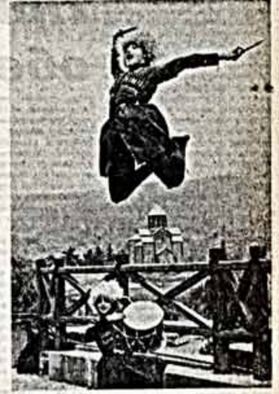
Группы детей играют в парке Ленинского района в Заур-Бетеманово — в составе детского творческого ансамбля 3-4 детского сада № 10 Ленинского района.