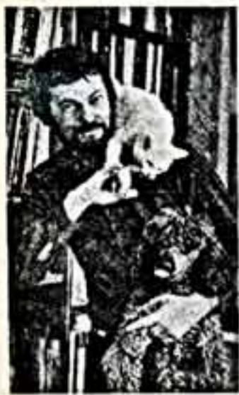
Художник из Навои