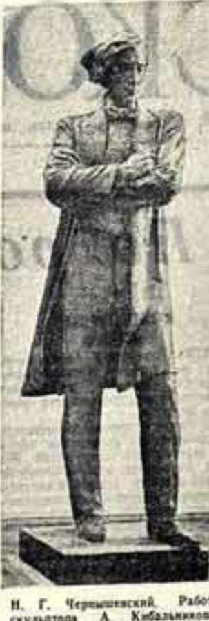
Н. Г. Чернышевский. Работа скульптора А. Кибальникова...