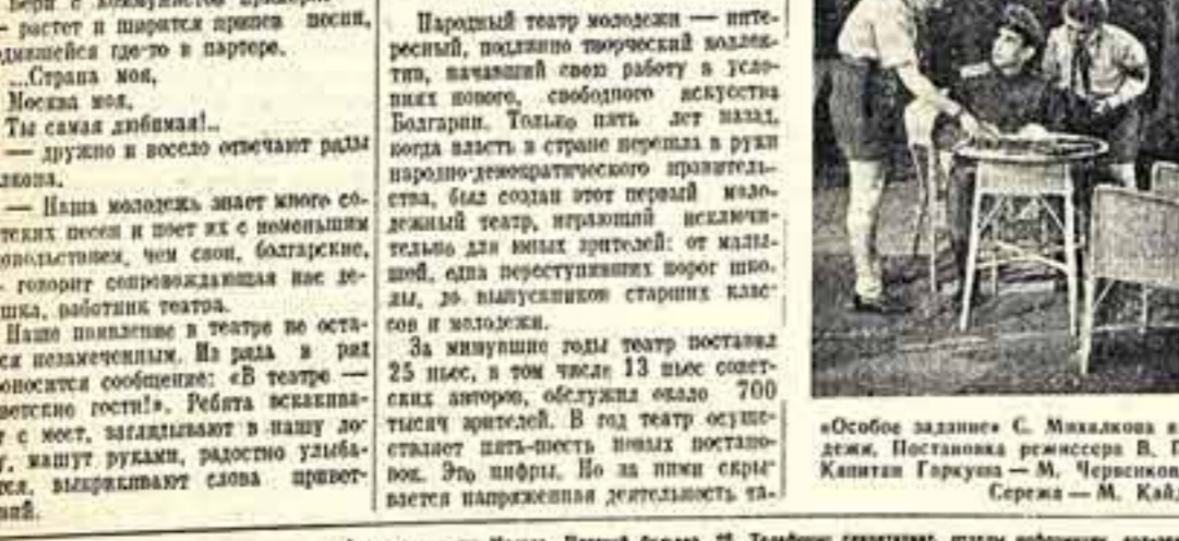
«Общее задание» С. Михалкова в болгарском Народном театре молодежи...