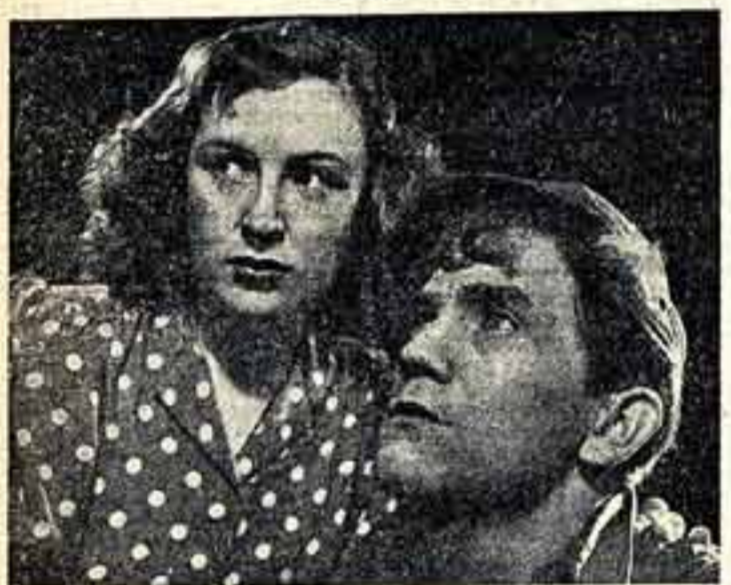
Сцена из спектакля «Молодая гвардия» в постановке Пражского театра киноактера...