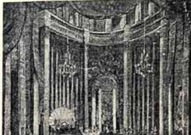
Закончилась конкурсная программа Ленинградского Большого драматического театра им. М. Горького...