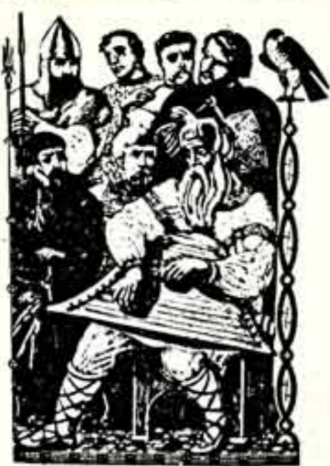
Графика В. Савицкого.

...Но, взглянув на солнце в этот день. Поднялся Игорь на светило: Середь белых дымов тень Ополчьих русских похлыла. И не ждал, что сулит судьбина, Кляла прощальна: «Братки в дружина!»