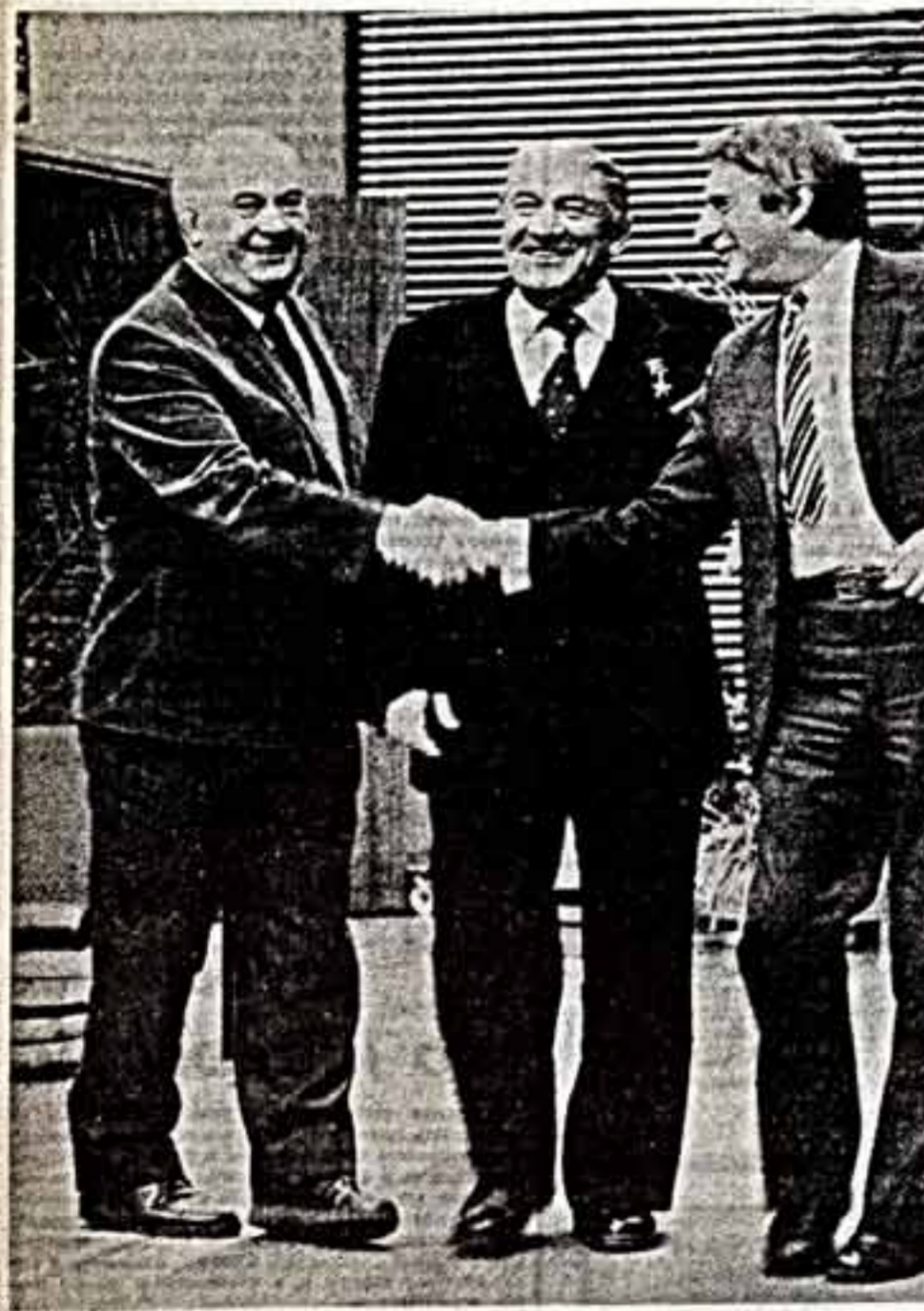
Популяризаторы советского кино — Евгений Моргунов, Николай Крючков и Сергей Колосов.