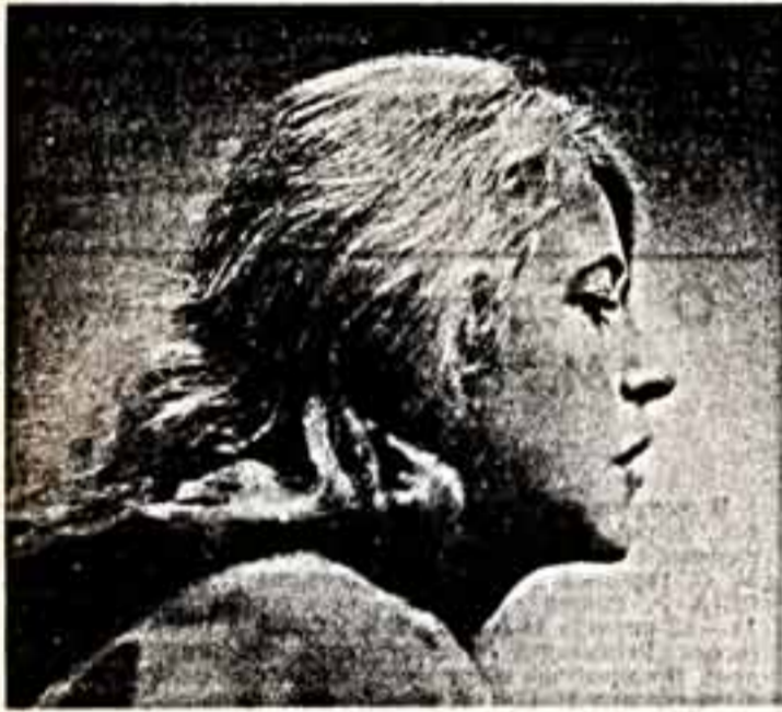
В городской Доме культуры старинного Пскова каждому талант ради. Здесь есть русский народный хор с ансамблем старинной музыки, клуб самодеятельной песни, театр слесарей, музыкальный театр. Его спектакль «Князь Игорь» стал событием в культурной жизни города.

Актив Дома культуры — рабочие, инженеры, учителя, студенты безвозмездно в свободное время реставрируют старинное здание, где будет работать экспериментальный центр молодого творчества.