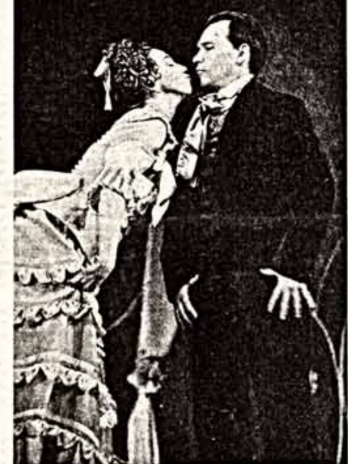
Прекрасный вечер в. Солякуба «Беда от нежного сердца» вернул в оживленный «Студия». В розовых рубашках актрисы Виктория О. Солякуба разорочивается это сентиментальная и смешная история о не в веру влюбленной женщине и ее женихе. Наши страсти со счастливой концовкой в постановке Л. Ермоловой пришлось по вкусу оживленным зрителям. Ведь жить человеческое над не чудом.

В свое время открытием для столичных театралов кругом стала постановка «Ричард III» Шекспира, осуществленная Ульяновским театром драмы. И вот — новые гастроли старейшего театра на Волге.