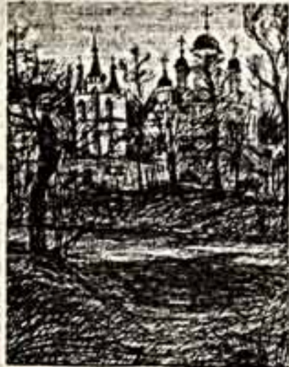
● Спаса церковь.

2 июня в Центральном доме художника (Крымская наб., 10), открывается выставка произведений известного московского графика Натальи Варботченко. Мир, возникающий на ее полотнах полон гармоничной пластикой, воздуха и света. И в то же время загадочен и необъясним, потому что эти виртуальные пространства, случайные портреты, цветы, пустынная ночная улица — наизыскаемые изображения словно бы намекают на нечто большее, чем на само дело изображения, они полны смутных предчувствий, а порой и таинственности.