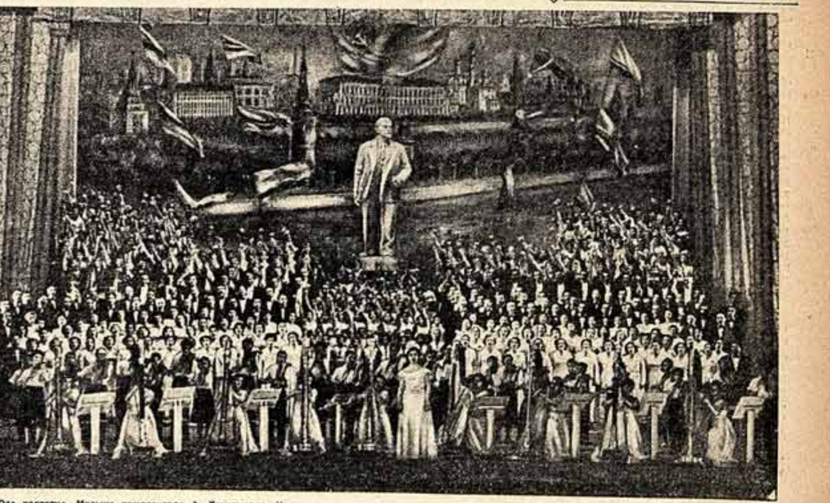
«Ода радости». Музыка композитора А. Хачатуряна. Исполняют участники декады.

лета — крестьянский танец и адажио первого акта, танец четырех лебедей и другие — сопровождалась дружными аплодисментами зала. Горько похвалил балетный коллектив театра, министр иностранных дел Франции Кристиан Пинно заявил, что он восхищен зрительскими: она с абсолютной точностью следуют за музыкой, необыкновенно пластичны, динамичны. По окончании спектакля советские артисты, вышедши на авансцену, засыпали цветами. Первые отклики парижских газет свидетельствуют о том, что выступления советского балета начались успешно. Газета «Пари пресс интрансжан» пишет: «Постановщик Бурмейстер создал очень стройный и полный равновесия спектакль, в котором хореографические находки сочетаются с великолепным стилем. Виолетта Бовт обладает ценными качествами, она продемонстрировала талант и грацию». «Кордебалет», — указывает газета, — является большим точным механизмом, гибкость и стройность которого образцовы. «Модернизм» здесь несет мимолетный характер, ансамбль полон такта и благородства». Газета «Фрэнс суар» также оценила высокое искусство кордебалета, который, по ее словам, проявил дисциплинированность, экспрессию и гибкость. Газета отметила прекрасную технику балеринны Виолетты Бовт. Парижские гастролы Музыкального театра имени К. С. Станиславского и В. И. Немировича-Данченко продлятся месяц. Л. ЦВЕТАЕВА. ПАРИЖ. (По телефону).