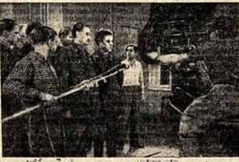
Рабочий момент съемки.

техники специализируются в этой области. Например, в типографии «Гудок» из 13 инженерно-технических работников с высшим и средним специальными образованиями один работает в «сменных» цехах — стереотипном и ротационном. Из 8 работников «Гудка», обучающихся в вузах и техникумах, ни один не готовился для работы по этим специальностям. А ведь в таких цехах большая нагрузка и в столице, и на периферии!