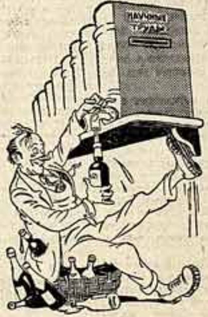
«Труды» Юдина сына над трудами отца. Рис. В. Фомичева.