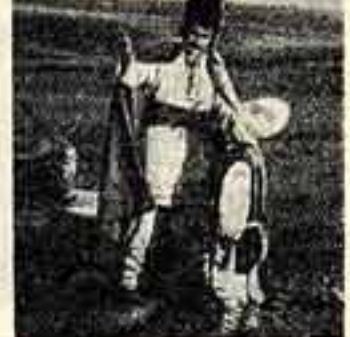
Кадр из фильма «Андреш»

Сказка молдавского поэта Ем. Вуква «Андреш» воспевает мужество и свободулюбие народа Молдавии.