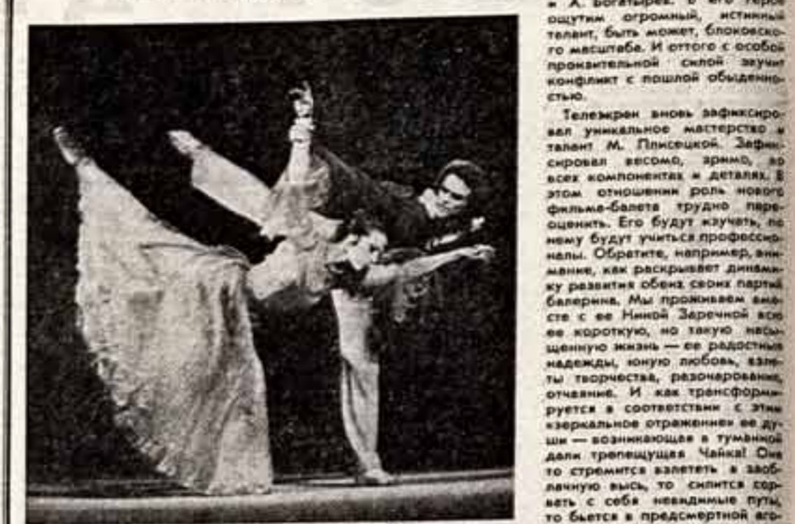
Откровенно говоря, внутрен...