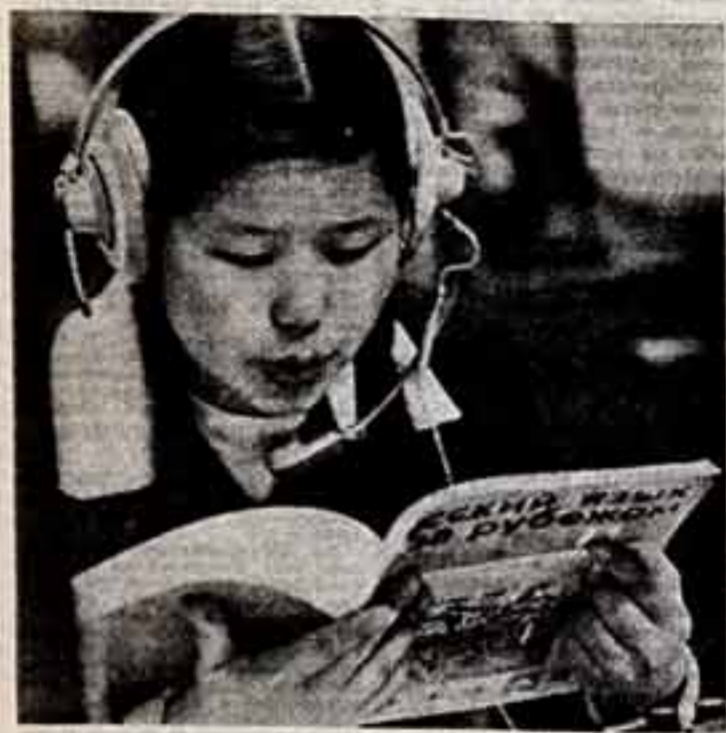
Пон Дам советской науки и техники в Удле-Ватере... Фото К. Болдоханова, М. Зетине (Фотохроника ТАСС).