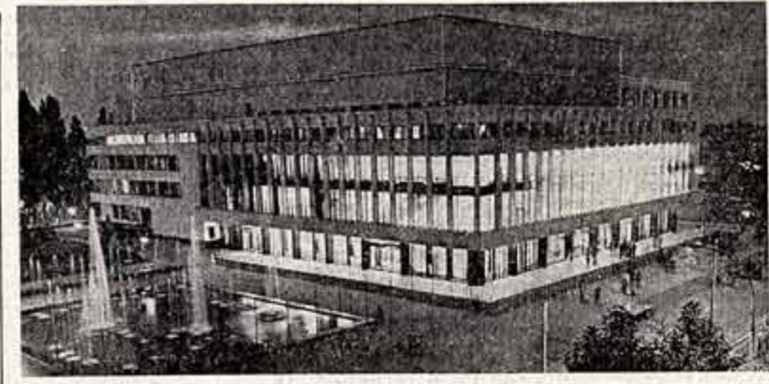
Кишинев. Дворец «Октябрь» на улице Пушкина