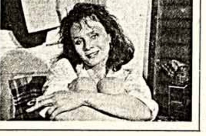
Сцена из фильма «Любовь и армия».