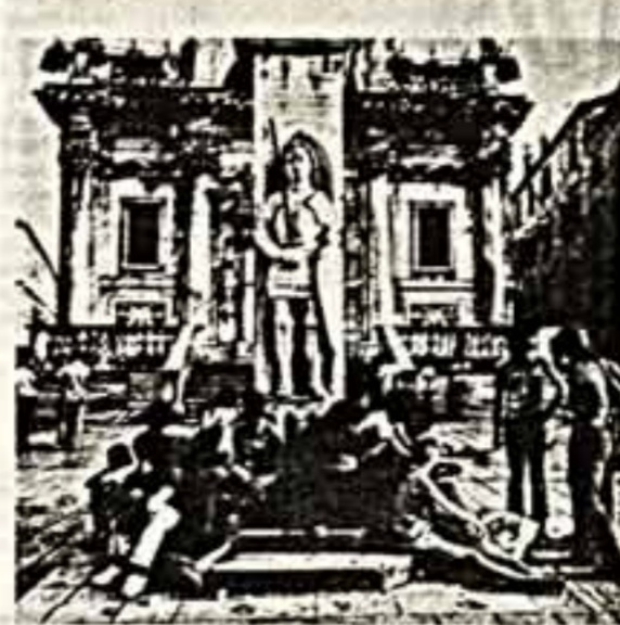
современному «пороту» войны, не в силах защитить трупики наших людей.