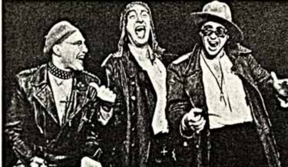
Сцена из спектакля «Осколки Стены».