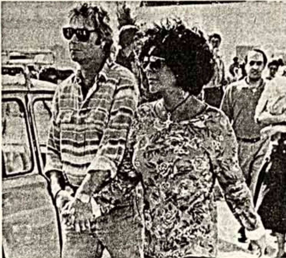
Элизабет Тейлор и Лорри Форрестер.