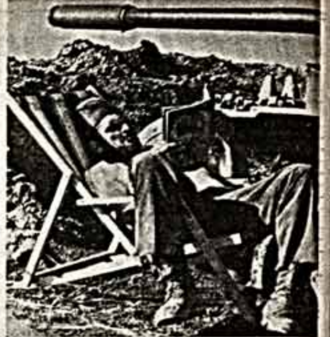
от солнца — защищает на белотельных северных горах, в горных головах молодых бойцов.