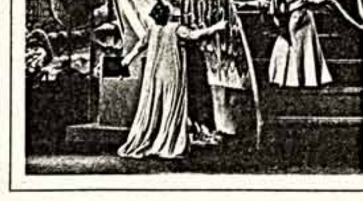
Сцена из фильма «Любовь и армия».

Фильм вызывает отнюдь не в отчаянно, нет в нем и обязательного лата — зрителю предлагается подумать о личном владыке каждого о постороине той Системы, того строя, которому еще и название не придумано, о нашей аине и беде — неизжитом рабстве и ярлыковости нашего сознания. Итак, Константин Гаврилов и Комаевкин (В. Тихонов) — бывший зампред Совмина, человек из БСЗ, любящий Брежнева, ныне пенсионер всеозного значения, приезжает уже в сегодняшнее перестроечное время в южный саиорский, обслуживающий оперделанный коттеджный на территории, в который он впервые его — который он первоначально, себе не дает, и нежность действий в побольше правдоподобна и в большем деле, и в малых. И так