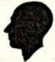
Баг. Вахтангов, 1922 год.