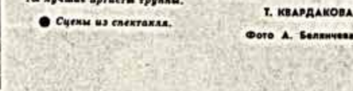
Сцены из спектакля.