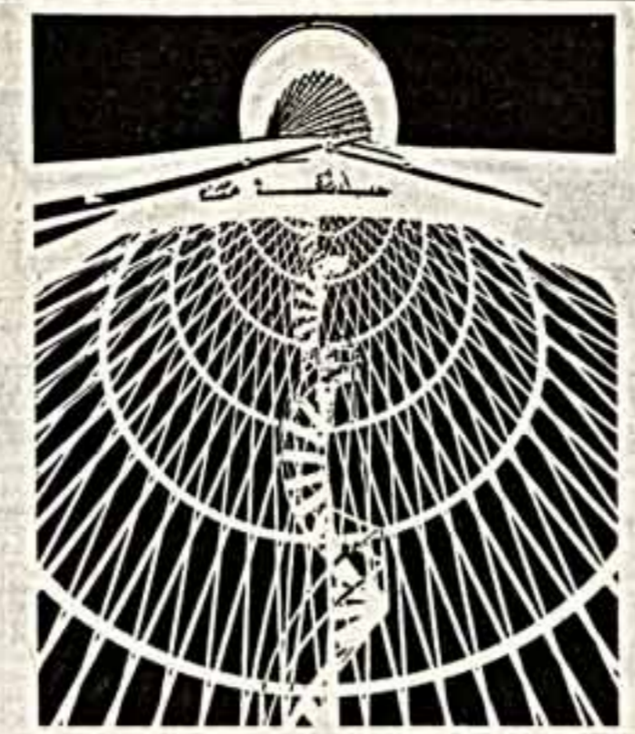
ПОЛИТИКА • КУЛЬТУРА • НОВОСТИ