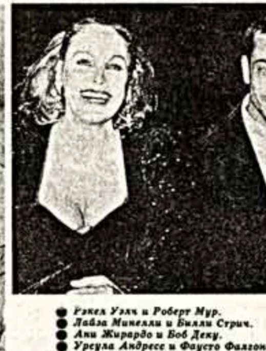
Ракель Уэлч и Роберт Мур. Лайза Минелли и Билли Стрич. Ани Жирардо и Боб Деку. Урсула Андресс и Фаусто Фаллоне.