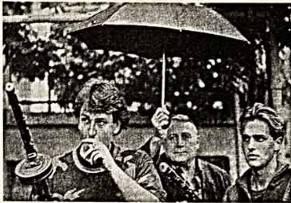
«Те, кто знает реку на земле, должны приехать в Дубровник, — сказал в начале века Бернард Шоу...»