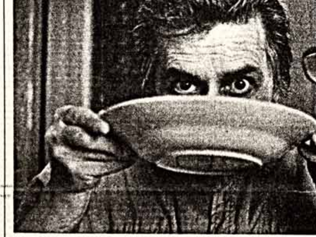
Хороша кашка, да мала кашка!

Внуки — мудрее! Ученики музыкальных школ городов Сумы и Москва уме в третий раз за последние время выступили с совместными и очень хорошими концертами.