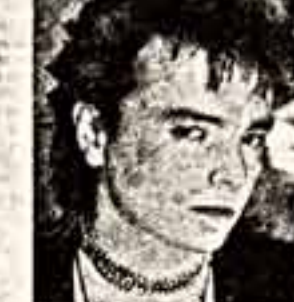
ЧТО МЫ ЗНАЕМ О НЕМ?