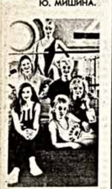
Ю. МИШИНА. Увлекающийся шоу «Сталлоне» рокетс.