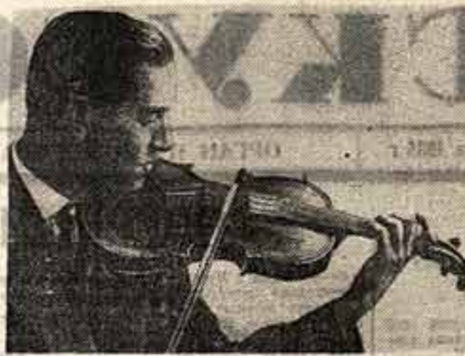
Давид Ойстрах, получивший вторую премию на международном конкурсе скрипачей в Варшаве