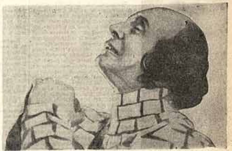
Сюжет: Гедия в роли короля Ричарда III.