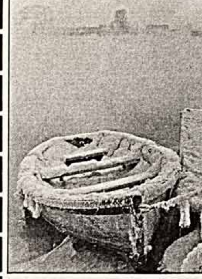
НА ФОТОКОНКУРС А. Кочетков. «Морозное утро».

20 декабря 1988 г. спорно-стихотворно скончался действительный член Академии художеств СССР, народный художник СССР Дмитрий Константинович Мочальский, выдающийся мастер жанровой живописи.