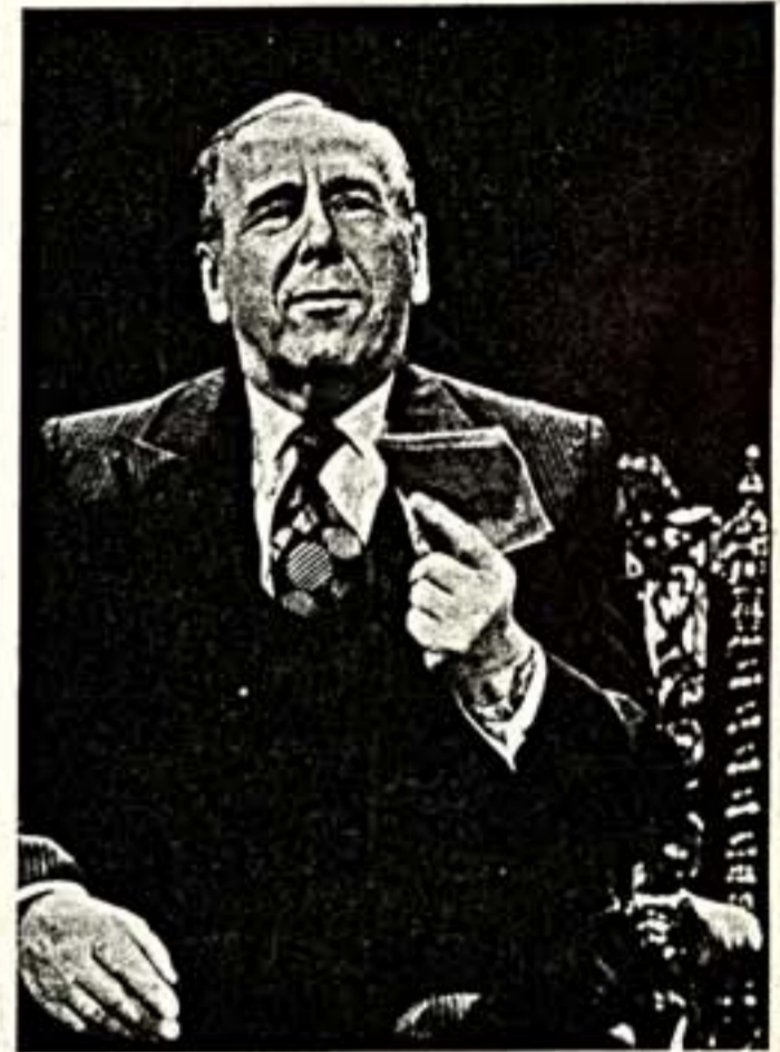
Вышла в свет книга «Ростислав Янович Плятт. Воспоминания друзей и коллег». Вы знаете, она даже внешне как-то благороднее, как-то она бодрее, высокая, словно чужая с седойной обложке и спокойное, мудрое лицо Плятта.

Он был, конечно, самым любимым артистом только что минувшего времени. Нет, у каждого из нас мог быть свой любимый актер. Но чтоб у всех вместе — вне сомнений, Плятт.