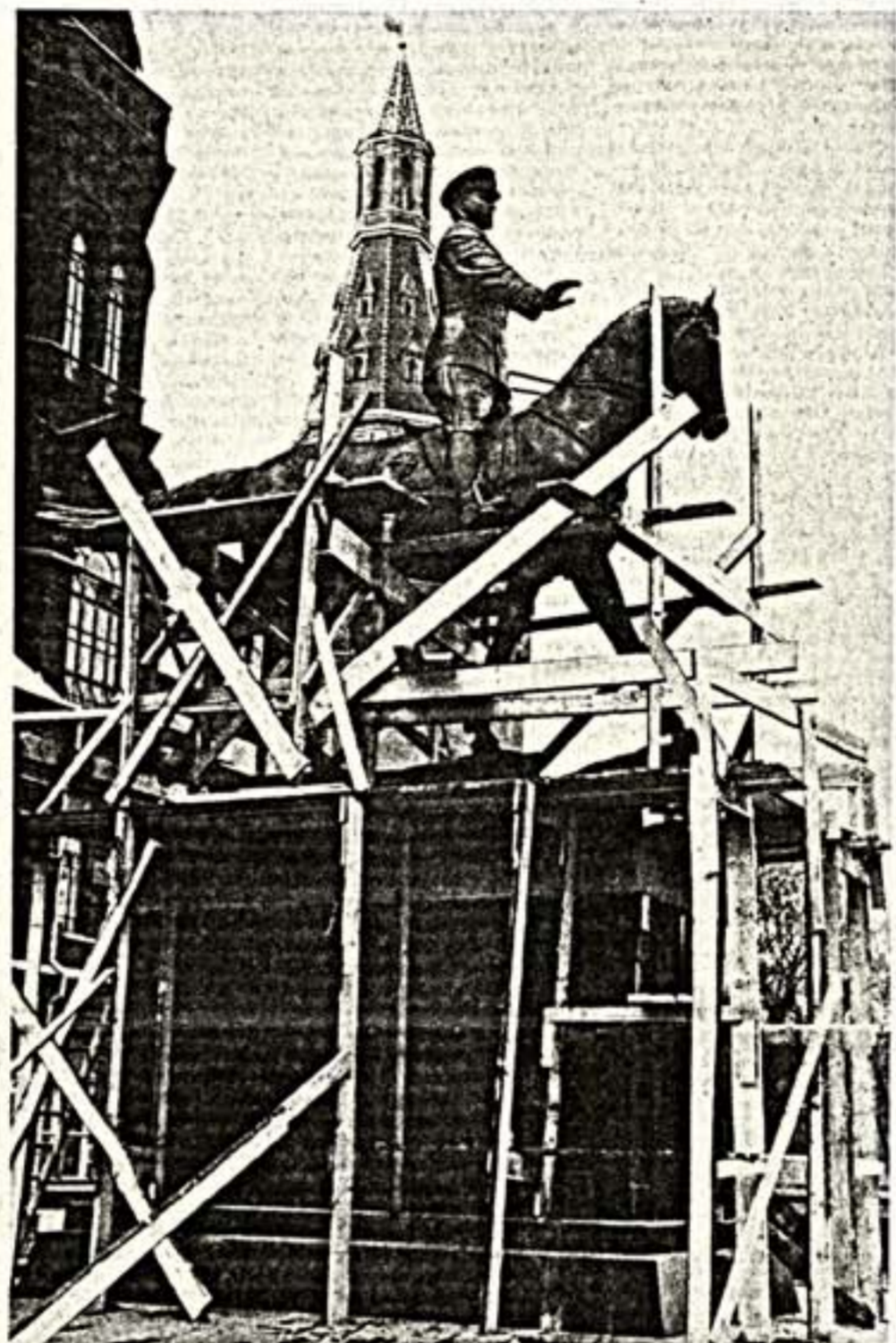
Памятник Г. К. Жукову на Манежной площади. (Снимок сделан 25 апреля).