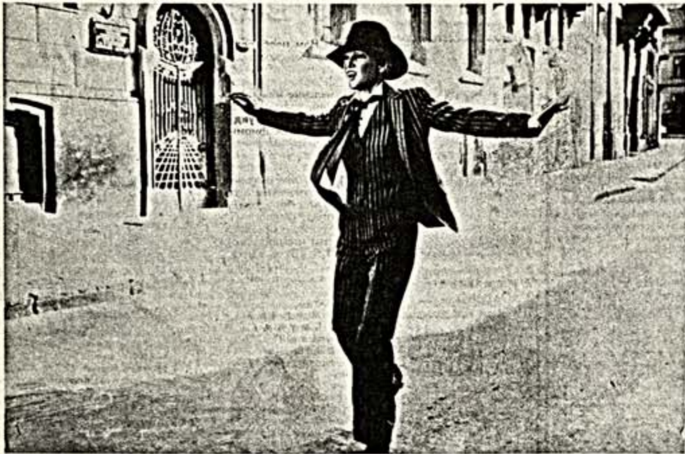
Людмила Гурченко в фильме «Рассвет на холмистых»

Я всегда мечтал о ней. И хотел подытожить блок, понять, осознать — что же это такое за феномен Людмила Гурченко!