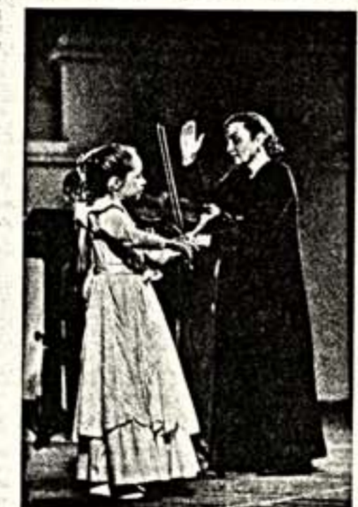
В пасхальное воскресенье Москва была залита солнцем. Казалось, во всем мире царит покой и добро... Светлому и трагическому празднику Победы посвятил в этот день концерт в Зале Чайковского Российский государственный академический камерный «Вальдаль-оркестра» — давний друг газеты «Культура», вдохновитель интересных творческих акций. Этот замечательный вечер стал возможен благодаря МОСТ-Банку.