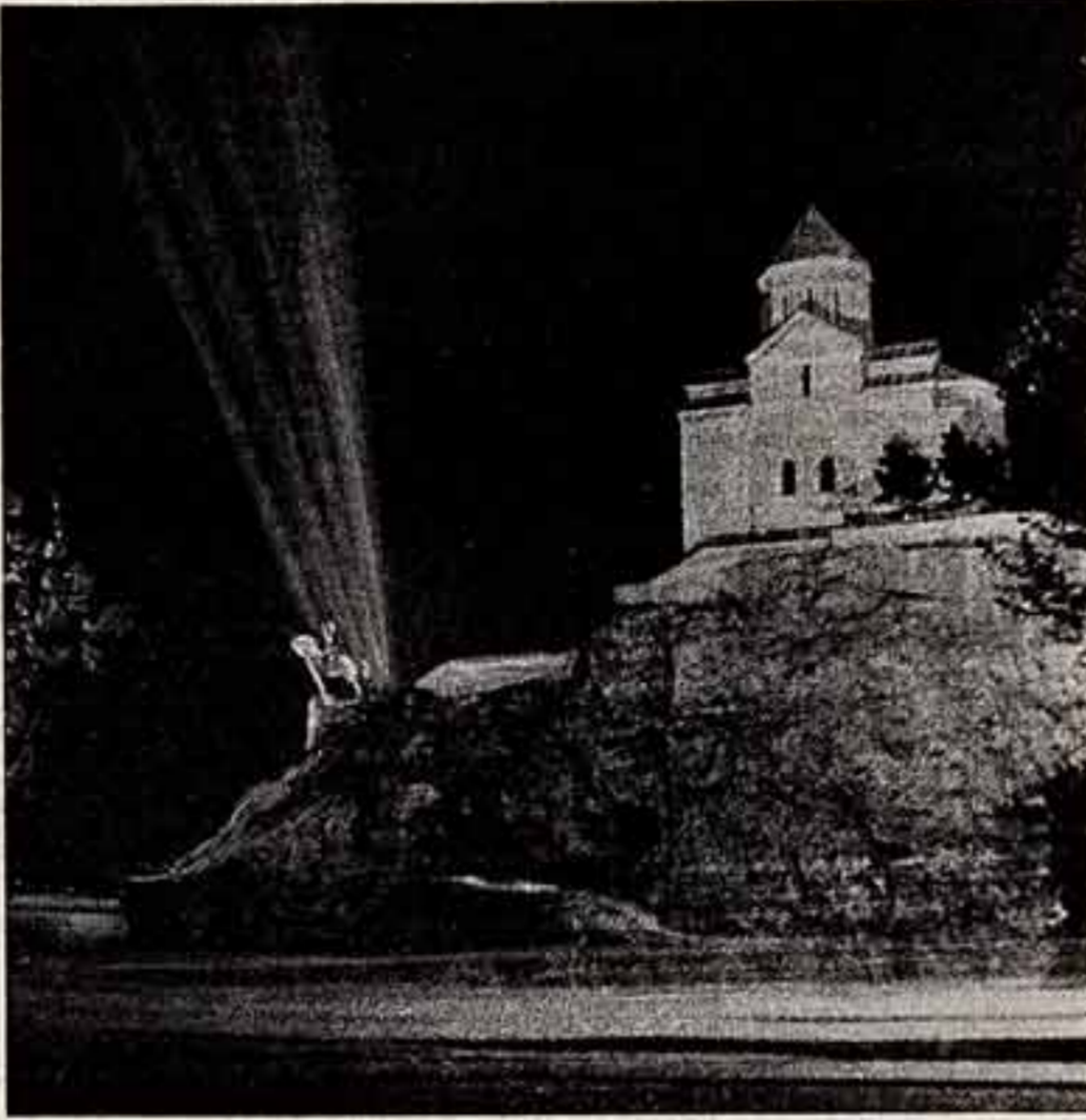
На скижке: уголок ночного Тбилиси.