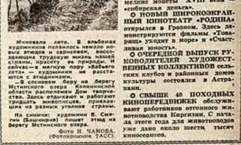
Многовато лето. В альбомках художников полыхало много новых этюдов и зарисовок, воспевающих трудовую жизнь нашей страны, красоту ее природы. Инициатива шахтеров получила новое развитие в форме содружества хозяйственных организаций и местных советских органов.