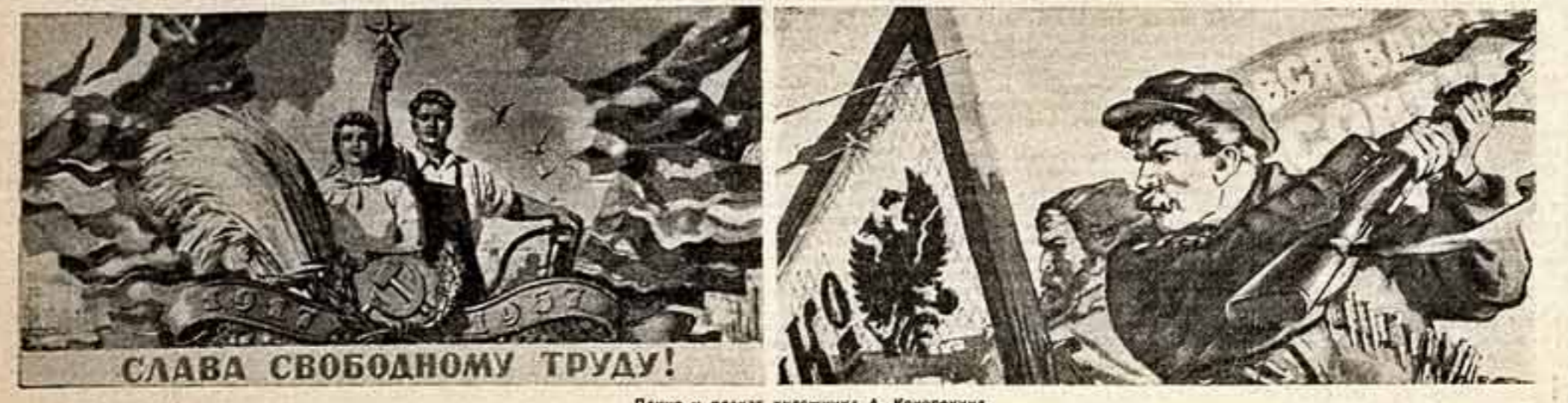
СЛАВА СВОБОДНОМУ ТРУДУ!

По поручению группы ученых Москвы академик А. Опариш внес проект решения, который был единодушно принят собранием. Ученые Москвы выразили свою волю к борьбе за запрещение ядерного оружия и его испытаний, заявили о своей твердой вере в возможность предотвратить войну и выразили готовность к совместным действиям с учеными любых стран во имя этих высоких и благородных целей.