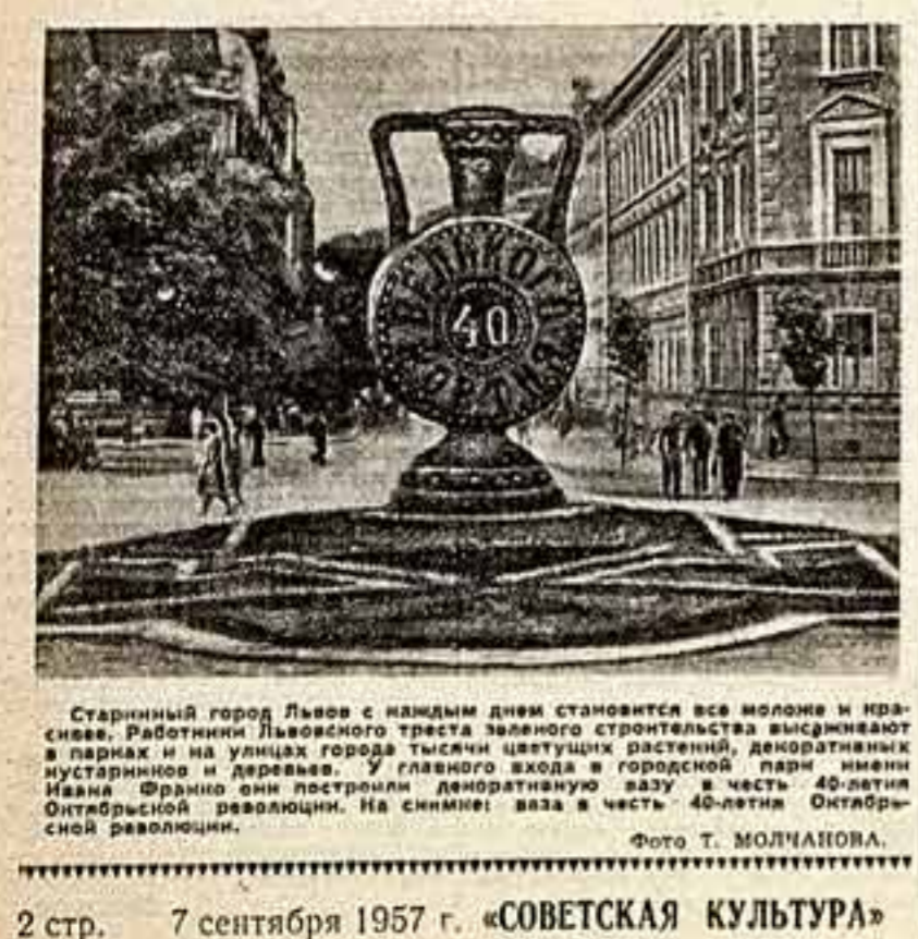
Старинный город Львов с нарядными днями становится все моложе и краше. Работники Львовского треста зеленого строительства высиживают в парках и на улицах города тысячи цветущих растений, декоративных инвентарных деревьев. У главного входа в городской парк имени Ивана Фрунзе они построили дендрологический сад в честь 40-летия Октябрьской революции. На снимке: ваза в честь 40-летия Октябрьской революции.