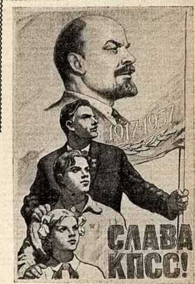
Панно художника В. Иванова.

Во многих плакатах воссоздан образ Ильича — великого и простого, отдаленного от нас годами и всегда хранимого в наших сердцах. Художник И. Гринштейн рассказывает в своем произведении «Мы победили!» о Ленине-вожде. На нас смотрят строге и мудрые глаза. Знакомый жест народного трибуна. Ильич говорит: «Производи-