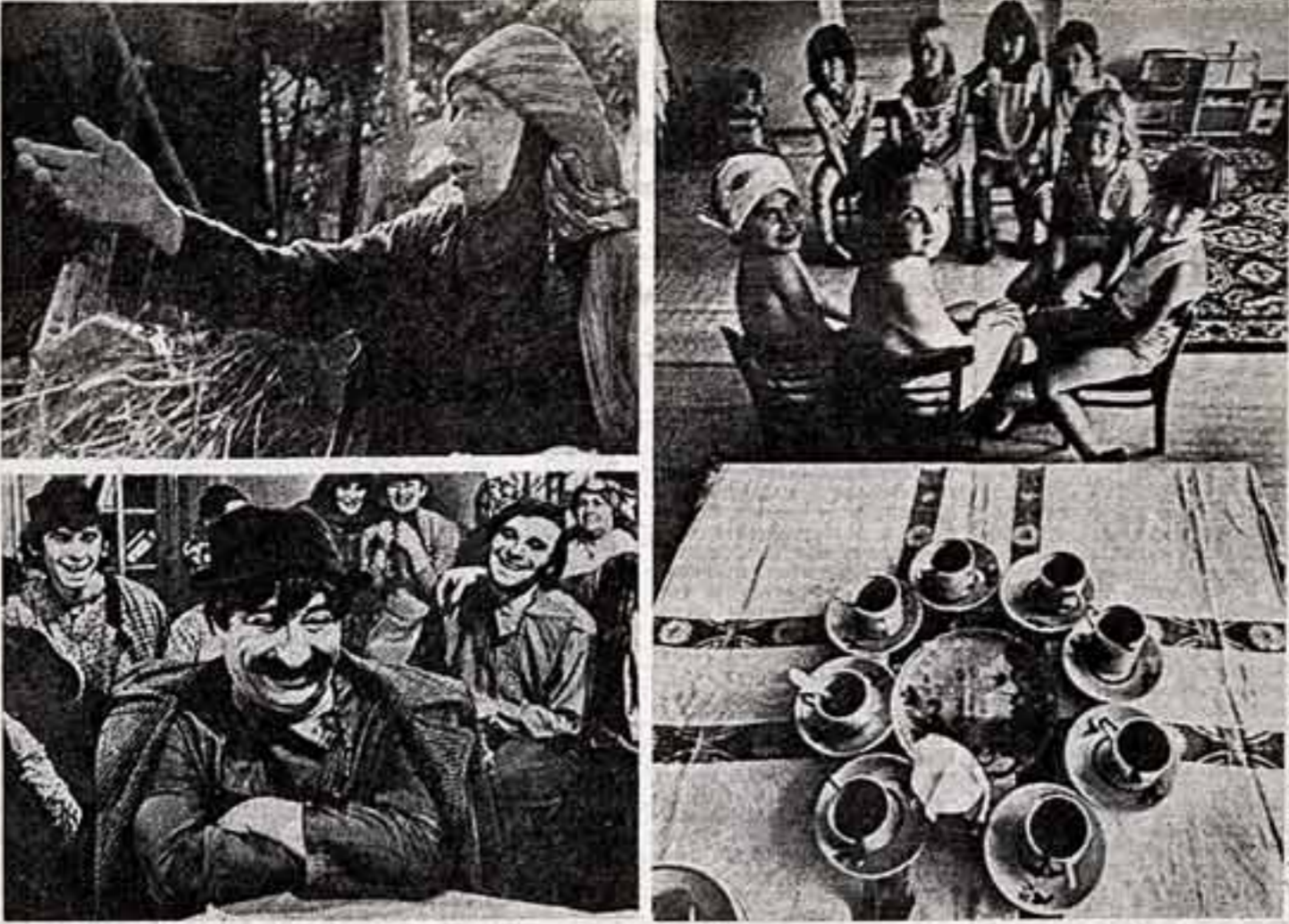
«За мир и взаимопонимание между народами, за гуманизм и социальный прогресс» — таков лозунгальный девиз традиционной выставки «Интерпрессо-то».

ЕГО ПРОВЕЛИ в подвальном помещении хранилища отомушину одну из дверей, пакеты и комоды.