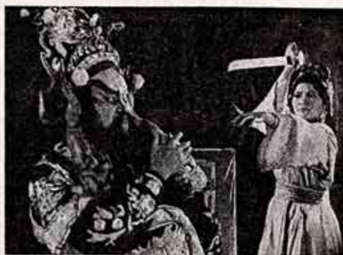
Сцена без декораций. Звучат национальные инструменты. Появляется девушка в национальной одежде. Ее мимика и пластика...