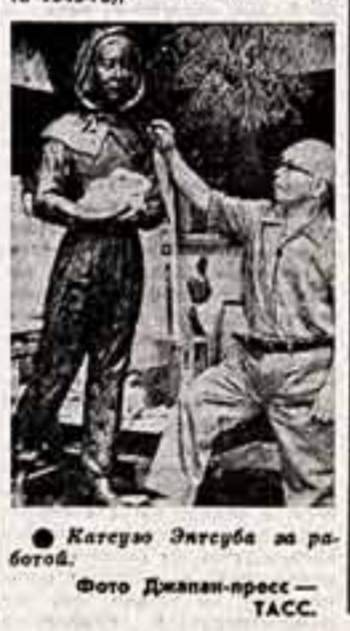
Казуюэ Эгусу за работой.

«Не допустим повторения ядерного кошмара Хиросимы и Нагасаки» — эту идею воплощает в себе скульптура японского художника Казуюэ Эгусы.