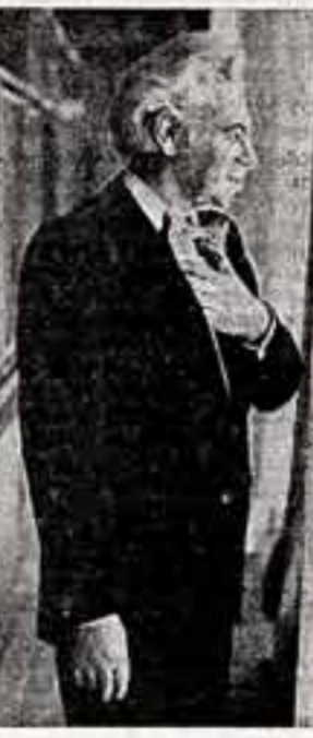
Я не вызываю слез, но у меня они текут. Заметил ли это? Аркадий РАЙКИН.

М. ПОБОРОНЧУК, наш соб. корр. Владивосток