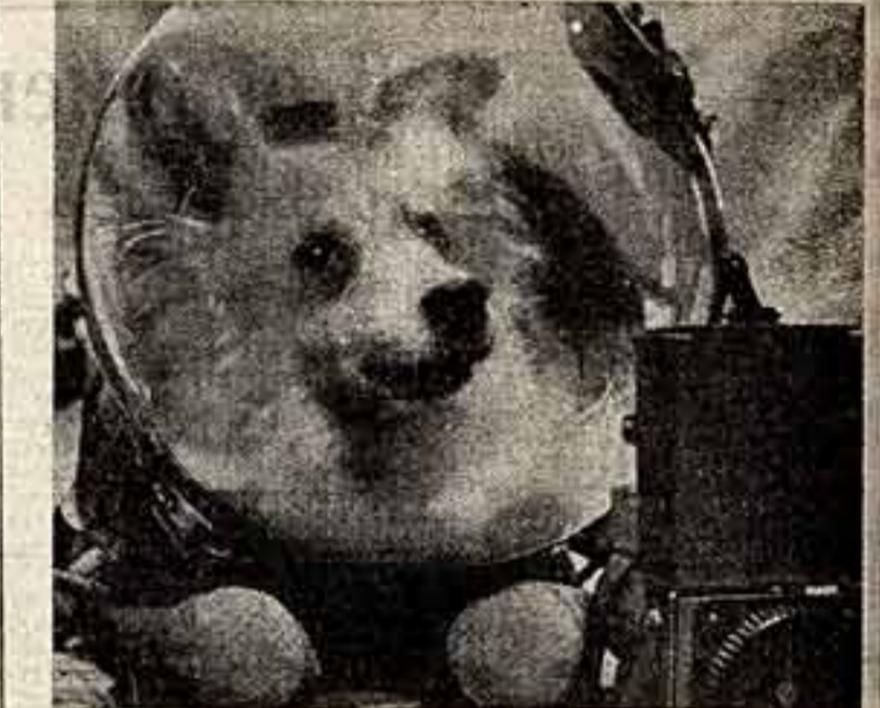
Осуществление плановой мечты человечества — полет за пределы Земли на другие планеты нельзя реализовать без глубоких знаний тех условий, которые существуют в межпланетном пространстве. Выпущены многие «космонавты» — соборы. Полет их в космосе позволяет получить необходимые сведения о приспособляемости наших организмов к столь необычным условиям. На снимке: «космонавт» пригласился и полету.

Вечер завершился большим концертом — своеобразным творческим отчетом московских артистов перед зрителями.