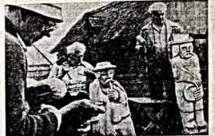
В польской селе Олава работают скульпторы. Здесь будет создан музей под открытым небом.