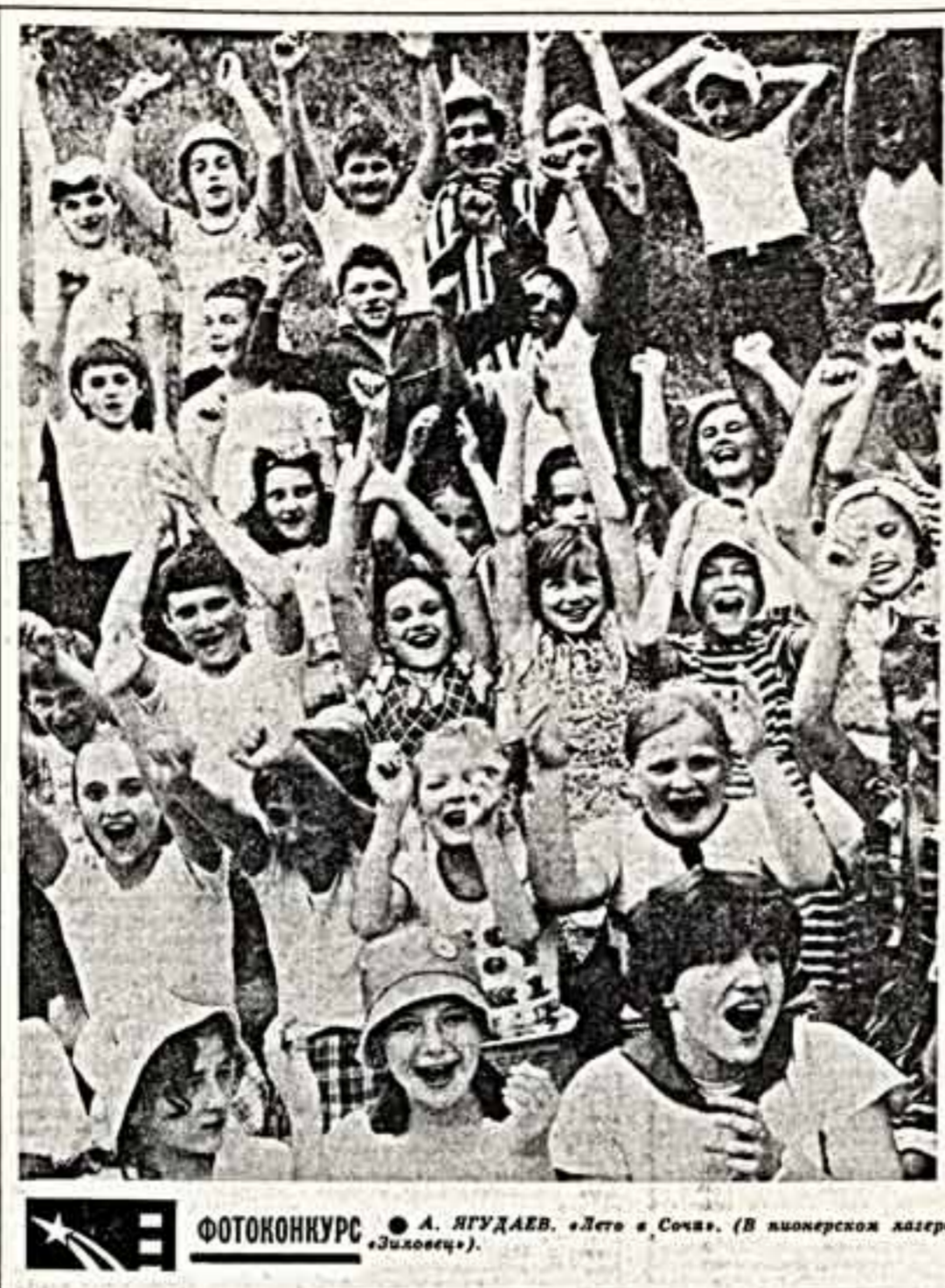
ФОТОКОНКУРС ● А. ИГУДАЕВ. «Лето в Сочи». (В пионерском лагере «Золотце»).

При старке очень устают спина. Знаете, необходимая гимнастика. Прогимнастик, наклонившись вперед. Затем — несколько поворотов головы. На очереди — наклоны вправо, влево, вперед, назад. Все движения должны быть плавными, ни в коем случае не делайте их резко, рывками.