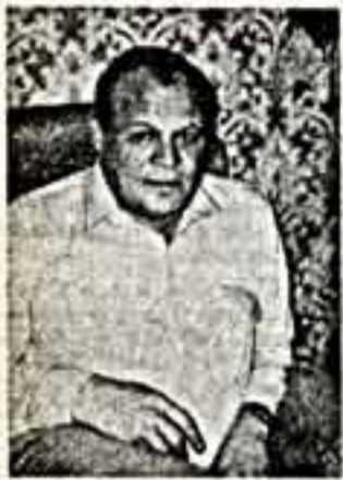
Сегодня в нашей гостиной — известный актер театра и кино, народный артист РСФСР Петр Щербанов.

— Помню: сестра привела меня в драматический кружок Дома культуры автозавода им. Лихачева. Кружок! Это сейчас самодеятельные артисты называют себя театральными коллективами. А цель — высшего преподавателя С. Днярова было одно: не столько научиться актерскому мастерству, сколько научиться жить в театре. Это было время, когда приходили все желающие — от шестнадцатилетних, каких был я, до семидесятилетних. А цель — высшего преподавателя С. Днярова было одно: не столько научиться актерскому мастерству, сколько научиться жить в театре. Это было время, когда приходили все желающие — от шестнадцатилетних, каких был я, до семидесятилетних.