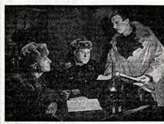
Кадр из фильма «День командира дивизии»

Перед подмосковным усадьбным домом, занятым под штаб дивизии, стоят часовые, и мы слышим из негройки разговор: «Немец-то далеко отсюда...» «Сюда — километра тридцать, а тут ближе». А в доме поднимается походная кроватка, команда Белобородов докладывает обстановку Жукову и Рокоссовскому, приехавшим сюда на передовую. Так начинается фильм «День командира дивизии» (сценарист Василий Соловьев, режиссер Игорь Николаев, оператор Инна Зарезина, студия детских и юношеских фильмов им. М. Горького).