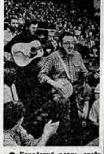
Канадский певец среди студентов Дредеки...