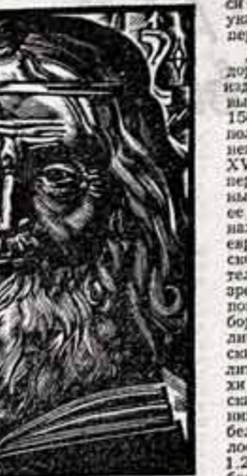
Портрет Ивана Федорова.

На витрине бережно припрятан от соляного света экземпляр «Апостола» 1574 года — первой датированной русской печатной книги. Это поистине жемчужина коллекции. Книга найдена в Сибири, в Красноярском крае. По записям, оставленным владельцами на пометках от времени страниц, можно точно проследить биографию из-