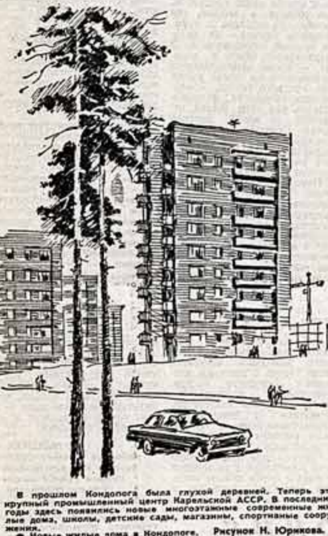
В прошлом Кондопога была глухой деревней. Теперь это крупный промышленный центр Карельской АССР. В последние годы здесь появились новые дома, школы, детские сады, магазины, спортивные сооружения. Новые жилые дома в Кондопоге. Рисунок Н. Юркова.

Э. ЛЫДИНА, наш спец. корреспондент. КИРГИЗСКАЯ ССР.