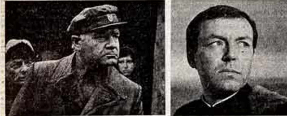
Виктор Миронович в картине «Три дня из английской харобана». (Автор сценария В. Силвае, режиссер В. Довган, студия им. А. Довженко).