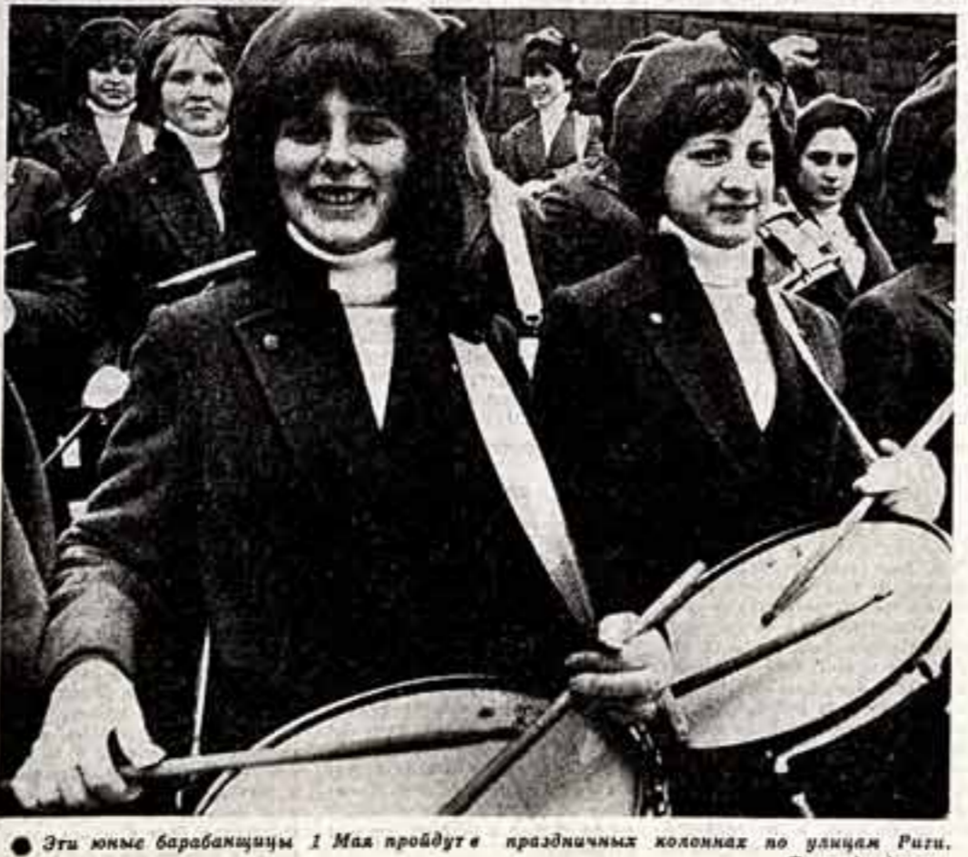
Эти юные барабанисты 1 Мая пройдут праздничных колоннах по улицам Риги.

Вопрос. Президент США Рейган намеревается за период до 1987 года поднять расходы на вооружения до (Ожидание на 2-й стр.)