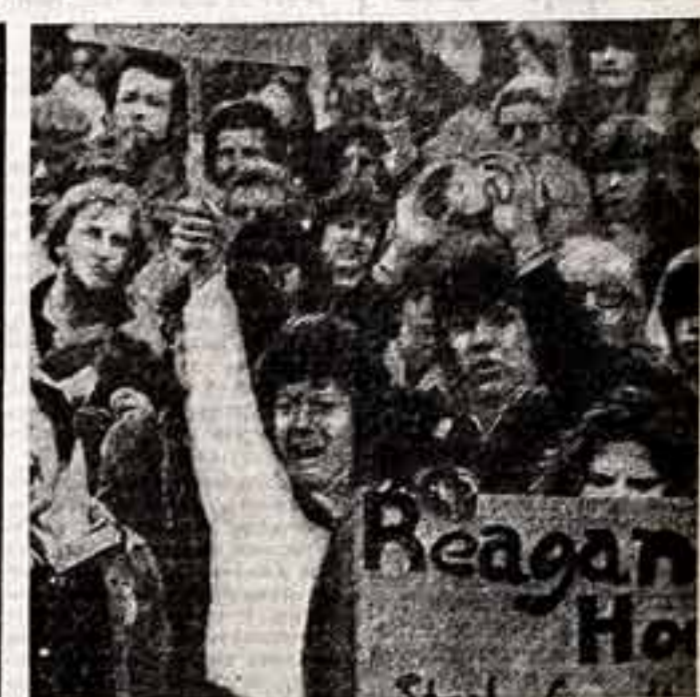
Ширится и набирает силу движение протеста против гонимых вооружений. Все активнее проявляют себя различные общественные миротворческие организации и антивоенные комитеты, действующие во многих странах. Не прекращается своя образная блокада ракетной базы Гринвич-Коммон, которую ведут женщины Великобритании. Полицейские дубинки и слезоточивые газы бессильны перед их волей и непреклонностью. Кампания за ядерное разоружение проходит сейчас не только на Британских островах. Группы защиты мира проводят многочисленные демонстрации «марш протеста» в Норвегии и Италии, ФРГ и Голландии. В Социалистическом Штатах Америки перед Пентагоном и Белым домом собираются манифестанты с лозунгами «Хлеба, а не ракеты», «Работы, а не ядерные бомбы». Весенняя волна антивоенных протестов, прокатившаяся по Западной Европе, переросла в новую форму, начав действовать так называемые «лагери мира». Миллионы ряды борясь за замораживание ядерной гонимости.

Я был в Литве и Грузии, видел все своими глазами. Я видел, что люди ведают, понимают, как им надо жить. Они говорят на своем родном языке, смотрят телевизоры на родном языке, ходят в национальные театры, сохраняют целостность национальной культуры. В Северной Ирландии же наш национальный язык подавляется. Нет, за то, что вы на нем говорите на улице, вы слышите оскорбления, вы слышите угрозы, вы слышите угрозы. Но много ли театров в Ольстере, где спектакль ставится на кельтском?». В Ольстере мы приехали в горнице, даже по его стандартам, время, всего лишь несколько минут спустя после взрыва в местечке Балликелла в лагере «Доррингвилл», свирепых бомбардировок клубом-диско-текой британских солдат на расколовшихся полахости ар-