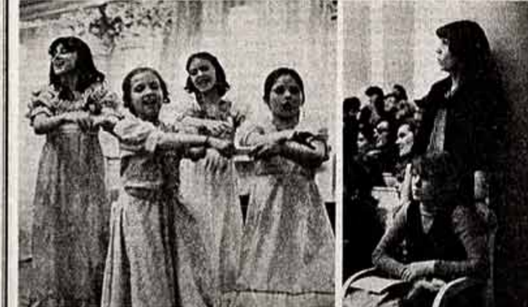
В форме мимик, захватывающей игры юным слушателям подается режиссером в структуре оперного произведения...