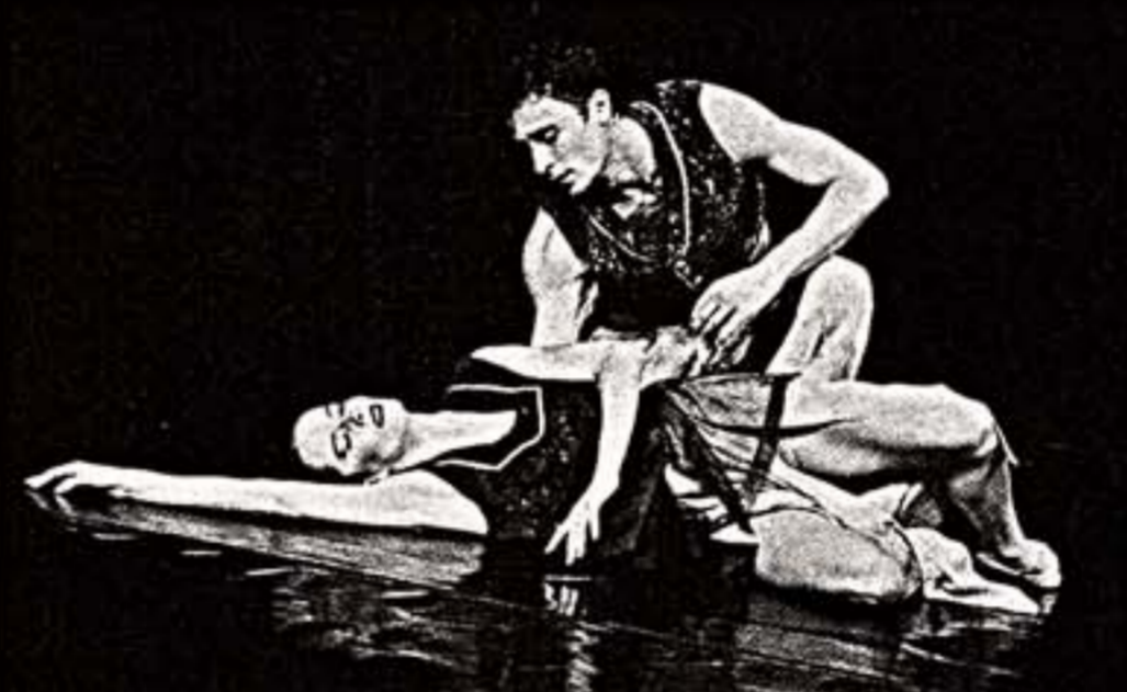
Сцена из спектакля "Пурим"