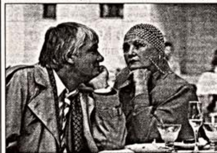
Кадр из фильма "Пианино"