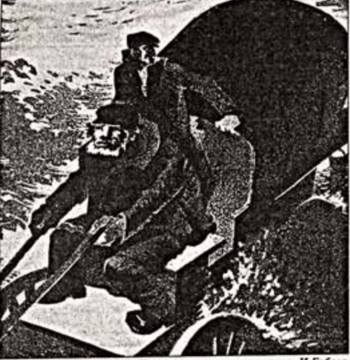
А. Быховский. Иллюстрация к киносценарию И. Бабеля по повести Шапова-Алейкина "Блуждающие звезды". 1926 г.

— Это все площадь, зеленая акцентная? — Нет, это площадь здания: здесь и фонды, и службы, и экспозиция. По мере освоения зданий мы делаем все новые залы для экспонатов. И сейчас, в конце этого года мы готовимся устроить в Михайловском зале открытый фонд скульптуры, и сейчас