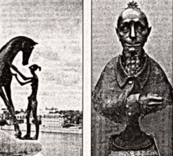
Д. Тугаринов. "Величие". 1982 г.

в нашей памяти красивый металлический мир оживает. Художник много ищет, пробует, создает разные варианты своего образа, одного мотива, добываясь более точного выражения своего замысла, что можно проследить на примере скульптуры "Маршал Жуков". Но в каждом из этих вариантов есть что-то неповторимое, что, быть может, будет "соборно" в какой-либо монументальной форме.