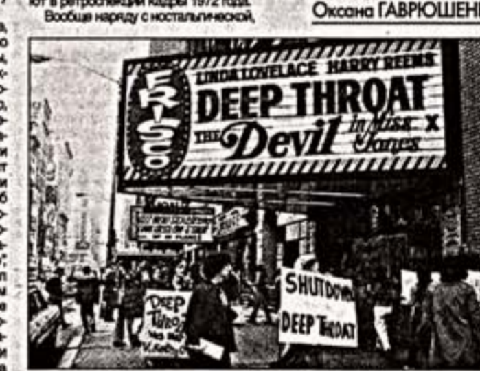
Кадр из фильма "В глубокой глотке"