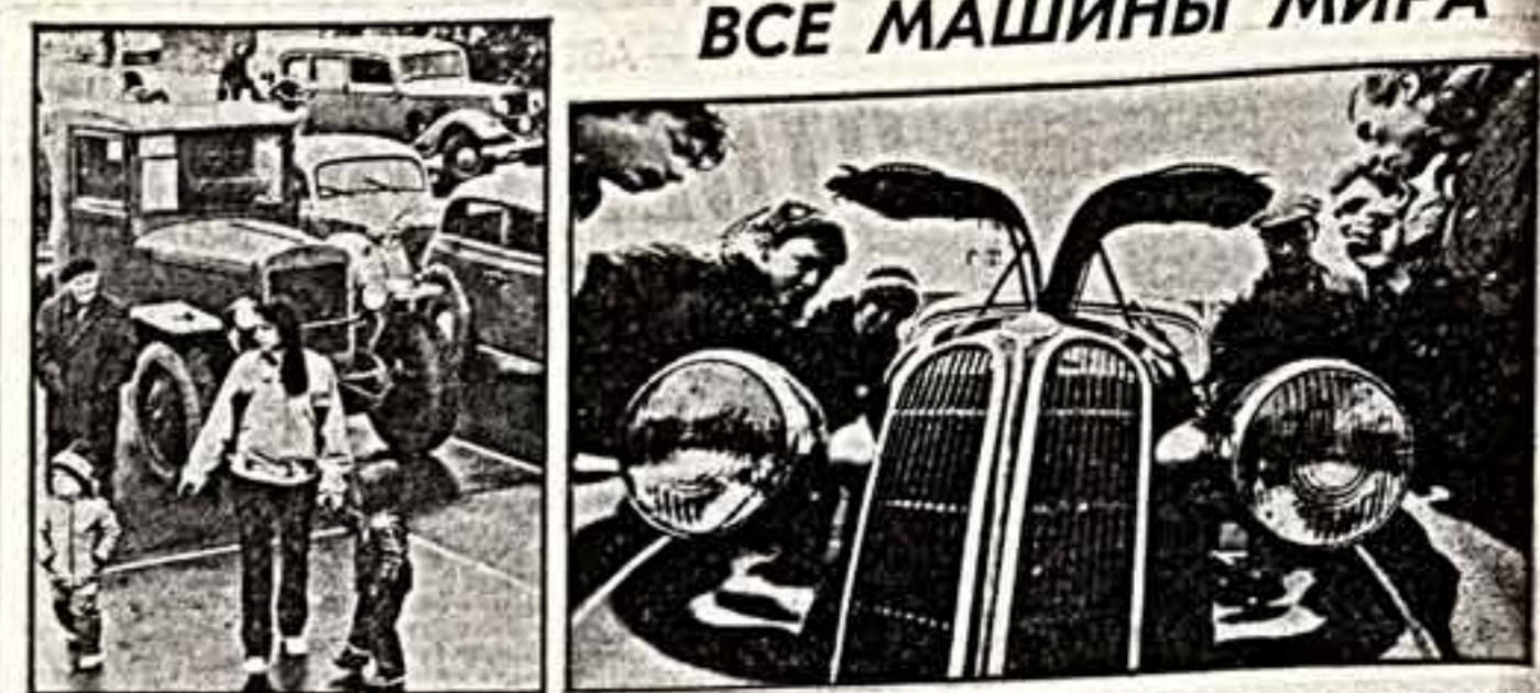
В Москве, на вокопспортивной площадке в Битце состоялась выставка-продажа старых автомобилей. Участвовало более 100 автомобилей из Москвы и городов страны. Выставка-продажа завершилась пробором автомобилей по улицам столицы.