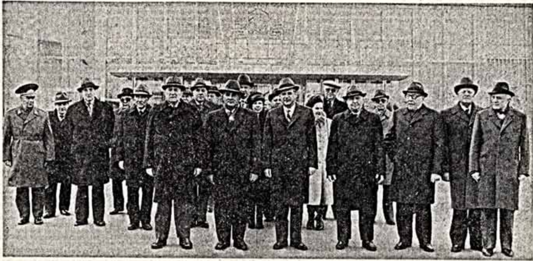
Во время проводов на аэродроме.