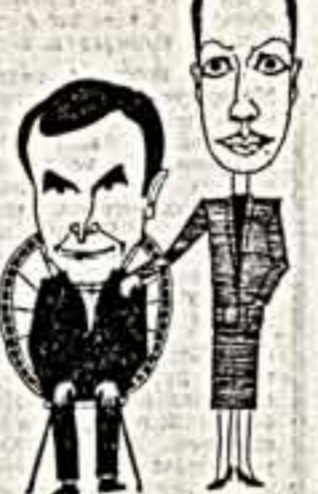
Н. Чурикова и Г. Панфилов