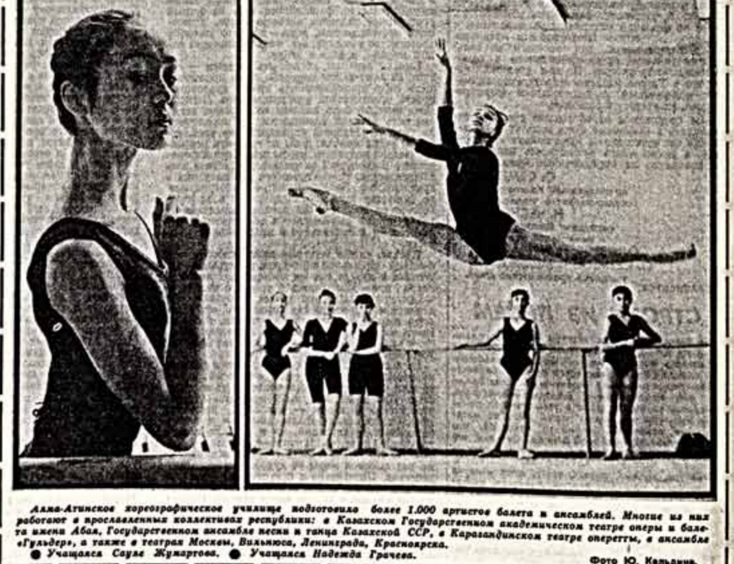
Алла-Атисинское хореографическое училище подготовило более 1.000 артистов балета и ансамбля...