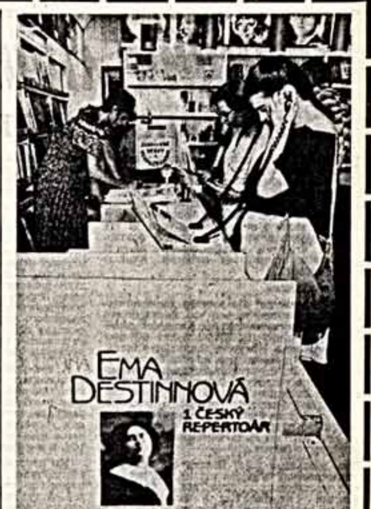
На фирме «Супрафон» выпущена первая пластинка Эммы Дестинновой (Эммы Китловой, драматическое сопрано, 1878—1930) — чешской певицы, которая была в Придворном опере в Берлине, и «Метрополитен-опера» в Нью-Йорке, в Национальном театре в Праге. В свое время ее считали лучшей исполнительницей партий Катерини, Тесты и Амди. Первая пластинка певицы, уже воспеваемая в хрестоматии, включает ее чешский репертуар. В последующие выпуски будут включены залес опер «Фауст» и «Лидия».