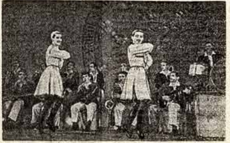
Ансамбль Грузинского политехнического института.

Важным хорошим вкусом, тонким пониманием специфики эстрадного искусства, они неизменно завершали победы. Разве не замечательный вкус, не подлинная музыкальная культура сделали выступление небольшого коллектива (всего 10 человек) Эстонского радио таким впечатляющим и своеобразным? Ум, хороший вкус отличал не всех участников конкурса. Особенно много упреков в этом плане можно сделать московскому женскому эстрадному оркестру под руководством Р. Романова. Стализация, манерничанье дуриного пошиба, случайный, будто наслеп собранный репертуар родились в результате погоня за оригинальностью, «эстрадностью» во что бы то ни стало.