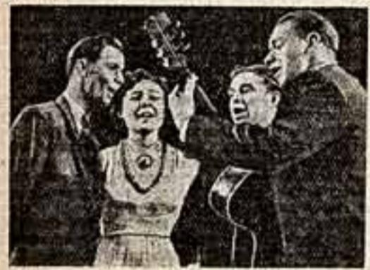
Артисты эстрадного ансамбля Эстонского радио.

У нас давно идут споры о путях развития советской эстрадной музыки. И любители, и недоброжелатели ее приводят множество аргументов, спорят, спорят, спорят. Но право же, споры эти так и не могут выйти за пределы теории. А пока профессиональная эстрада и критики решают вопрос, каким должен быть эстрадный концерт, что можно назвать джазом, а что инструментальным ансамблем, какова их специфическая исполнительская манера и что, наконец, вкладывается в «танцевальное» понятие эстрадной музыки, молодежь — любители этого жанра — сказала свое весьма убедительное слово. В этом мы со всей полнотой убедились на недавно закончившемся конкурсе эстрадных коллективов Всесоюзного фестиваля молодежи.