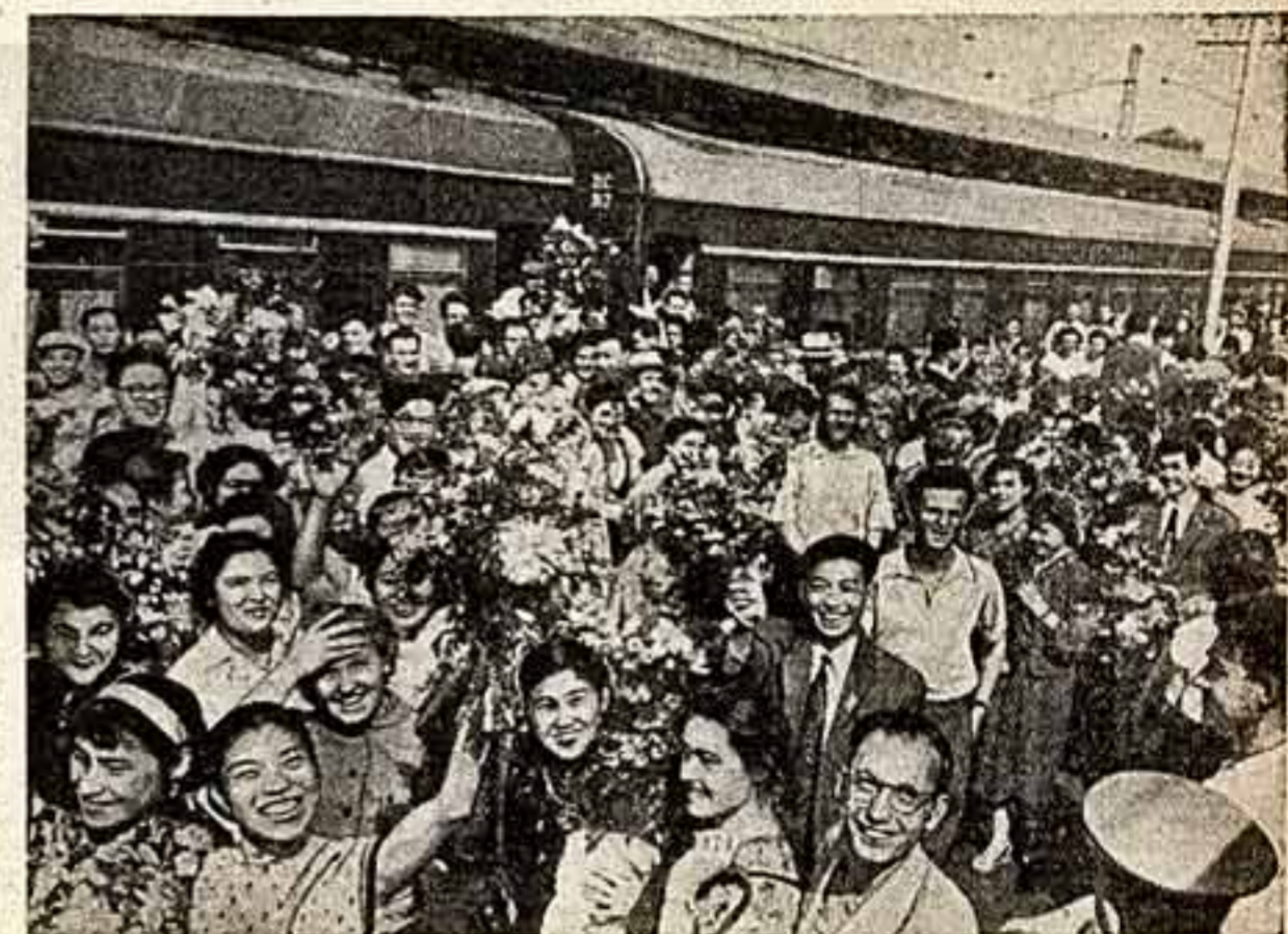
Встреча на Ярославском вокзале в Москве