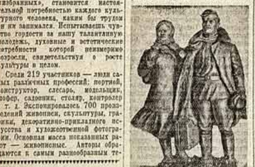
Среди 219 участников — люди самых различных профессий: портреты, конструкции, скульптуры, модели, шифер, садовник, стелар, контролер в т. д. Экспонировалось 700 произведений живописи, скульптуры, графики, декоративно-прикладного искусства и художественной фотографии. Основную массу показанных работ живописные. Авторы обращаются к самым разнообразным те-

Последняя выставка произведений молодых самодеятельных художников показала столь высокое профессиональное мастерство их, что наивысшей экспонированности работы любительскими представителями вряд ли признаны. Нам кажется, настало время найти другое определение художественной деятельности людей различных профессий, отдающих свободное время работе в области изобразительного искусства. Знакомство с выставкой наводит на мысль, что наступил такой период развития нашего общества, когда искусство перестает быть уделом «свободных», становится настоятельной потребностью каждого культурного человека, каким бы трудом он ни занимался. Испытываешь чувство гордости за нашу талантливую молодежь, духовные и эстетические потребности которой неизмеримо возросли, свидетельствуя о росте культуры в целом.