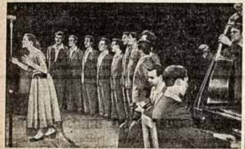
Молодежный вокальный ансамбль «Дружба» (Ленинград).

В соревнованиях принимал участие коллектив, приехавший из разных республик. У каждого из них был свой репертуар, свой замысел в решении программы, собственная, чаще всего ярко национальная манера исполнения. Но у лучших было общее, что и принесло им успех, — тонкий вкус, своеобразие, мастерство, талант, очарование творческой молодости — по сути, все то, без чего не может существовать настоящее эстрадное искусство. И еще один весьма важный вывод можно было сделать на этом конкурсе. У отдельных народов национальное искусство по своему характеру и складу, темпераменту, по музыкальным формам естественно и легко рождает так называемые эстрадные жанры. Ритмичность, синхронизация, динамичность грузинской народной мелодики как бы выливаются в страстную и эмоционально выразительную эстрадную песню, в оживленный танец. Ориентальность и замкнутость, характерные для грузинского мелодического рисунка, подкапывают и манеру вокального и оркестрового ансамбля.