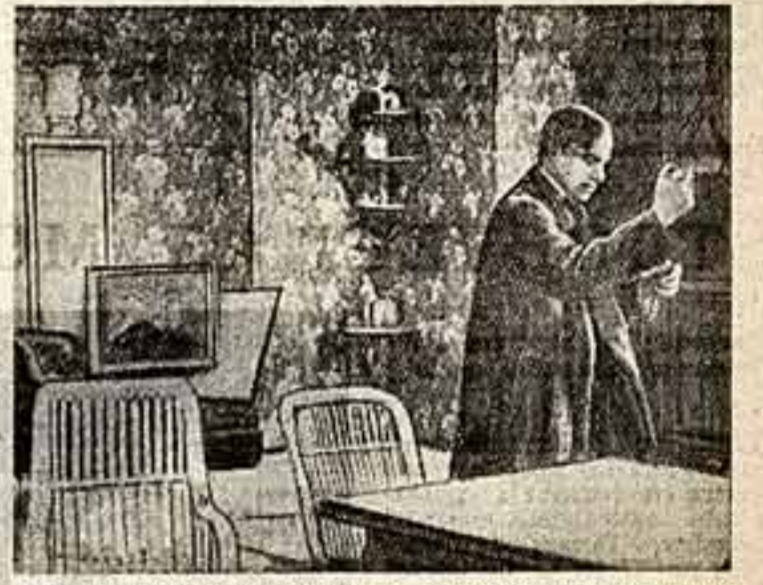
Кадр из индустриального «Завоженная Фильмой», В. В. Маяковский в роли художника.

Но больше всего нравился Маяковскому его третий, фантастический сценарий — о художнике, влюбившемся в записную книжку-бульварку, которая скрывает к нему с экрана и живет среди людей, а сама оказалась в плену. Обратило на полотно экрана. Маяковский