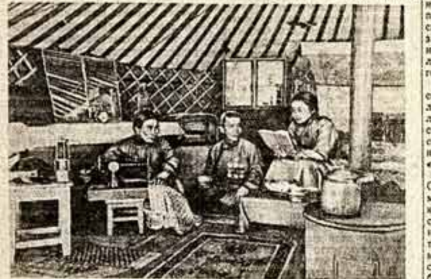
В монгольском юрте.

— Солнце и луна украшают ветвистые деревца. Прекрасная Валия украшает мое сердце, — поется в народ-