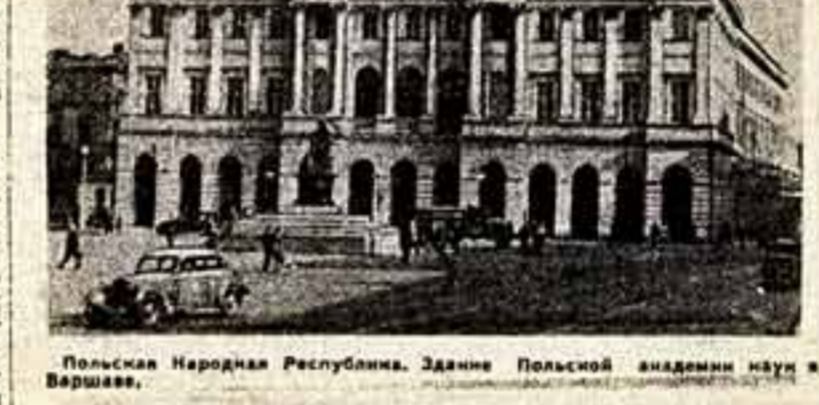
Польская Народная Республика. Здание Польской академии наук в Варшаве.