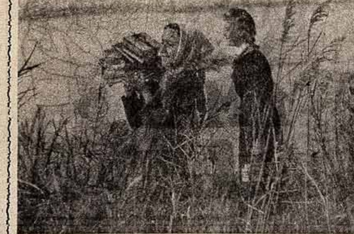
В волжских плаваниях, измывшимися зарослями идут эти девушки-инженеры на рыбачий стан. У астраханских рыболовов плавания совпали с горячими днями плавания. Кто может быть лучше после трудового дня, как не чтение новой увлекательной книги!