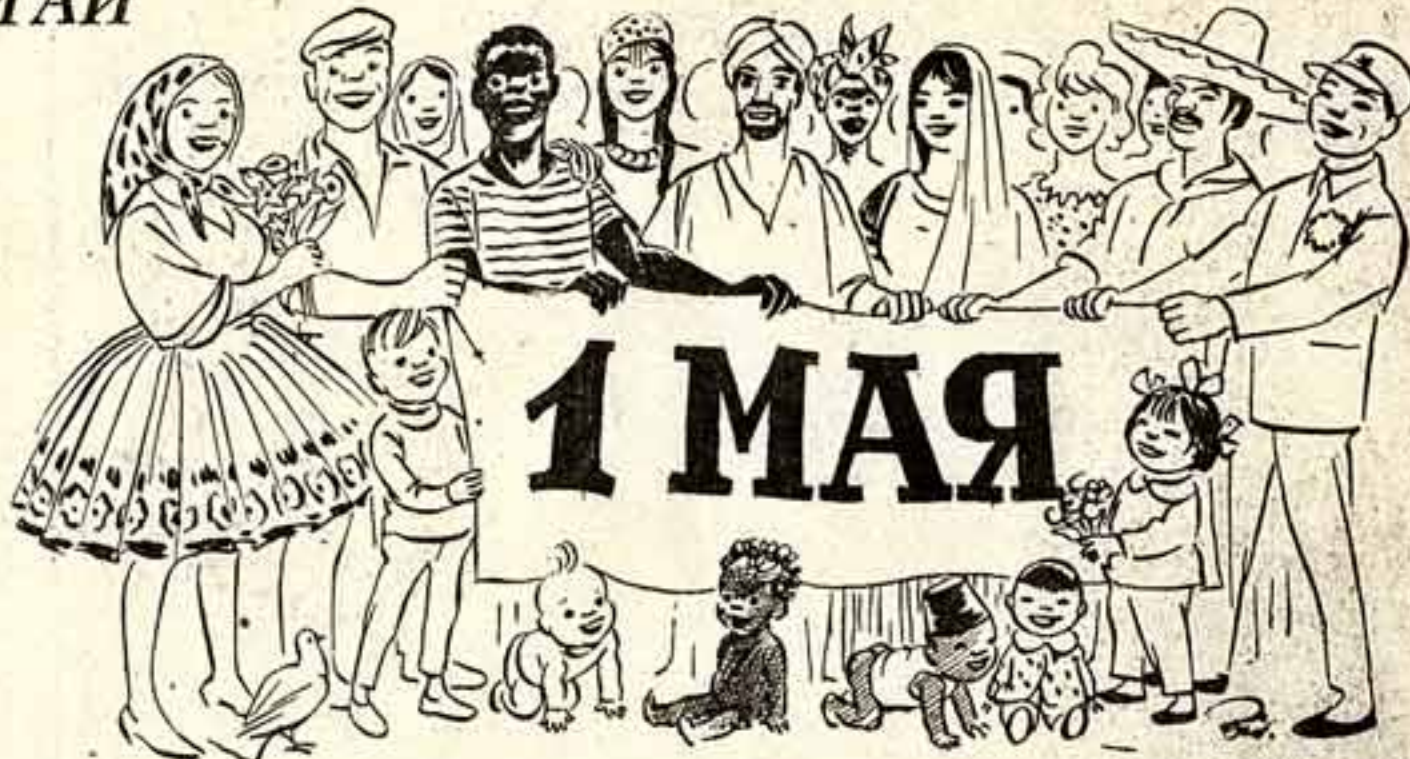
Рисунок Керуази ВИДСТРУПА (Италия) для «Советской культуры».

«Советская культура» выходит по вторникам, четвергам и субботам.