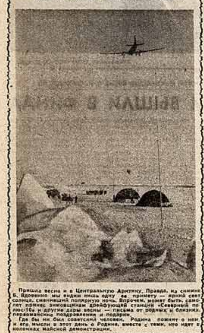
Пришла весна и в Центральную Арктику. Правда, на снимке Б. Вдовина мы видим лишь одну ее приметную — яркую светловатую, сменяющую популярную ночь. Впрочем, может быть, самолеты летят знобящим дождем у станции «Северный полюс» и другие дары весны — письма от военных и близких, первобытные подражания и подражи, родина помнит о нем, и его мысли в этот день о Родине, вместе с теми, кто идет в колоннах майской демонстрации.

НАШЕ ВРЕМЯ стремительно летит вперед. Еще сравнительно недавно коммунизм казался звездой, удаленной от нас на много световых лет. А сегодня он стал близкой, реальной целью, и которой ведет нас партия коммунистов. Почти физически мы ощущаем пульс гигантского сердца нашей великой партии, создающей новый мир, ее мужественную силу и гениальную разумность, взметнувший во Вселенную космические корабли.