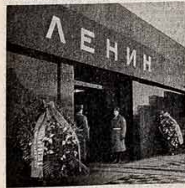
Во время возложения венка.