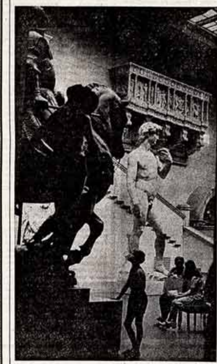
ФОТОКОНКУРС Н. ТУКЕЛЬ. «В жипе всеобщего танства и красоты».

К. ВАВЖИНОВИЧ, преподаватель черчения и рисования, АНТОПОЛЬ, Дрогобычский район, Брестская область.