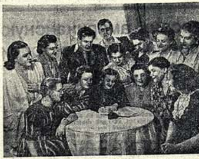
Артисты Ленинградского Малого оперного театра подписывают под Стокгольмским Воззванием Постоянного Комитета Всемирного конгресса сторонников мира...

В помещении фойе Большого театра состоялось собрание гастролирующего в Москве коллектива Ленинградского академического Малого оперного театра.