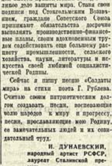
Н. ДУНАЕВСКИЙ, народный артист РСФСР, лауреат Сталинской премии.