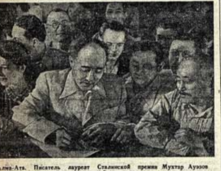
Алина-Ата. Писатель лауреат Сталинской премии Мухтар Ауэзов подписывает под Стокгольмским Воззванием.

Из одних газет, в которой я живу, распространено высказывание о том, что открывается безбрежная и величавая панорама Москвы. Но громады новых зданий — удивительно плодородная и магнетическая земля.