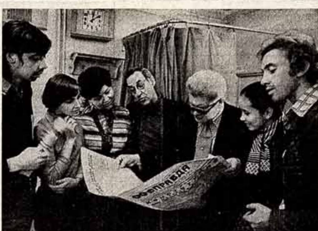
Советские люди повсеместно горячо и заинтересованно обсуждают проект Конституции СССР и задачи, вытекающие из решения Генерального секретаря ЦК КПСС, Председателя Конституционной комиссии товарища Л. И. Брежнева на майском Пленуме ЦК КПСС.

Трудились с гордостью отмечают великие достижения первого в мире социалистического государства, расцвет советской демократии, сплоченность всего народа вокруг Коммунистической партии и ее Высшего Центрального Комитета. Творческие коллективы отмечают пути дальнейшего улучшения своей практической деятельности в интересах коммунистического строительства.