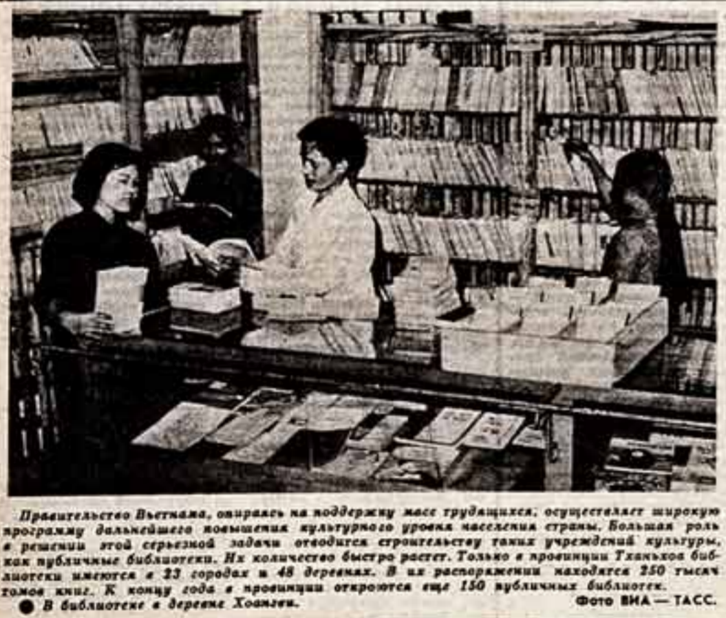
Президентство Вьетнама, опираясь на поддержку масс трудящихся, осуществляет широкую программу дальнейшего повышения культурного уровня населения страны.