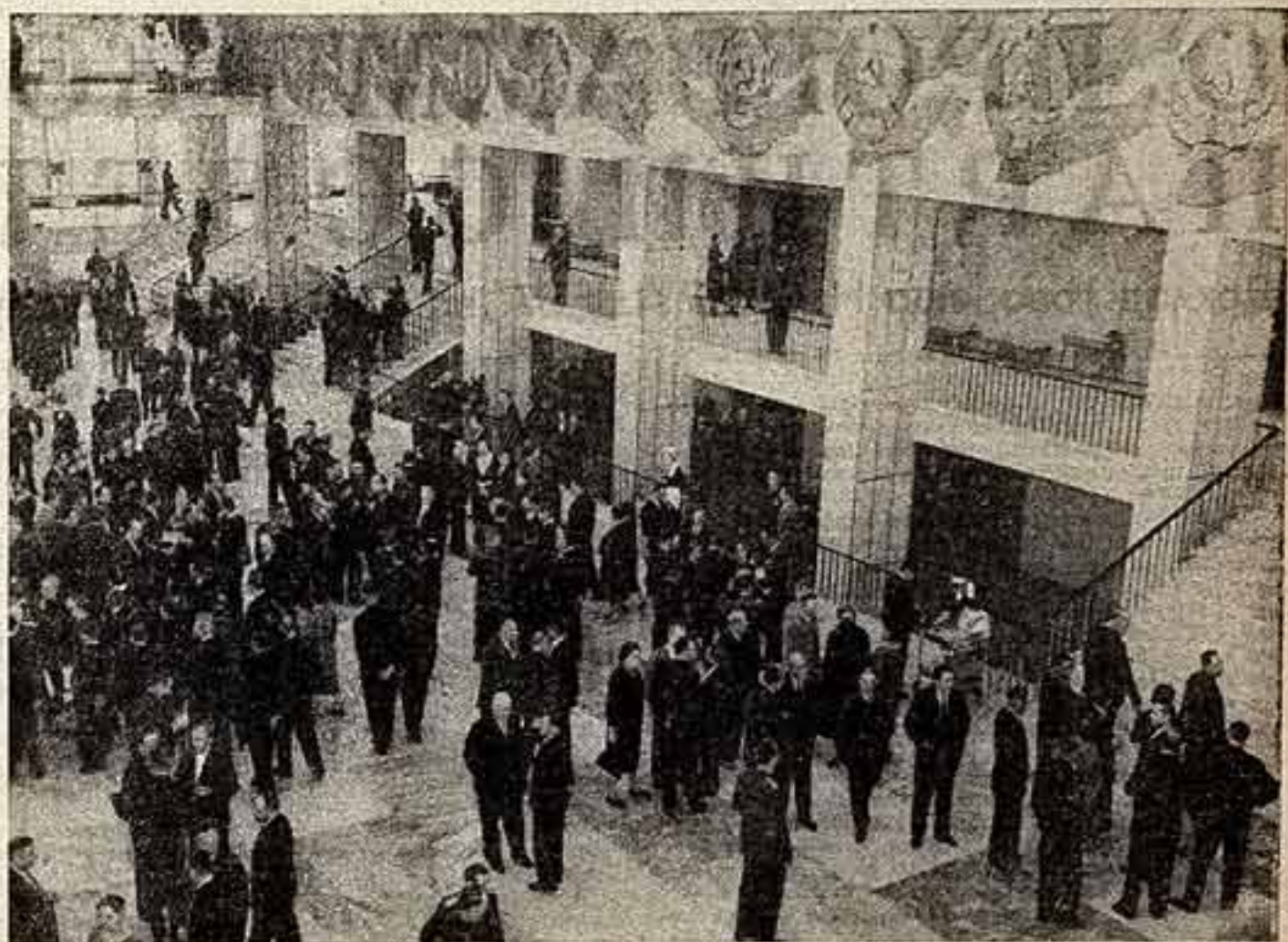
МОСКВА. XXII съезд Коммунистической партии Советского Союза. На снимке: в фойе Кремлевского Дворца съездов.

В Вене сегодня еще нельзя прочитать отчет ЦК КПСС полностью, газеты