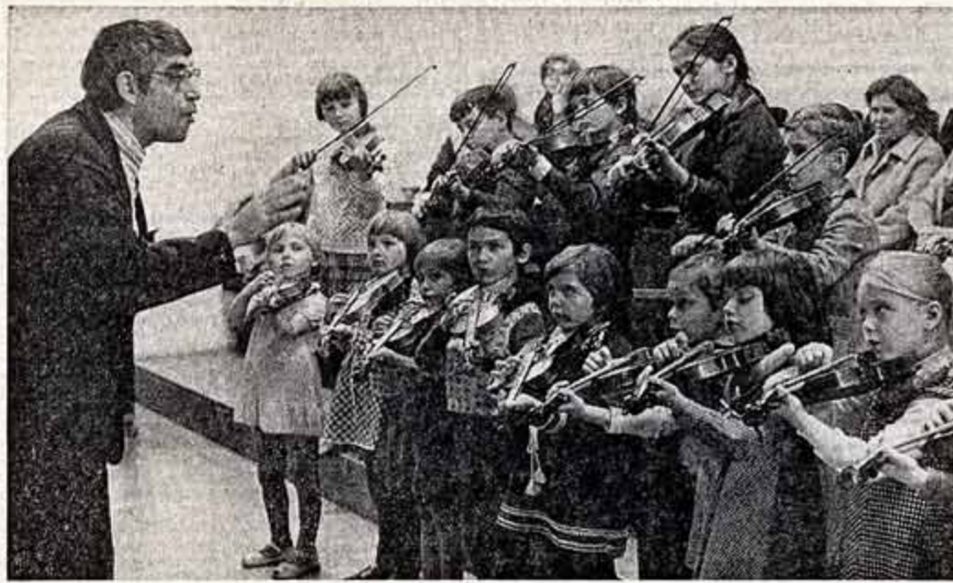
Н. СЕННИН. «Звучит ансамбль юных скрипачей Безгородского дворца культуры железнодорожников».