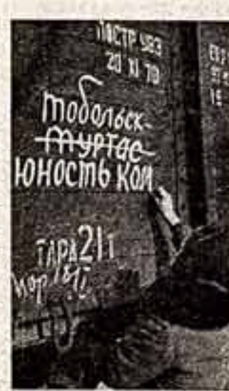
руководителей стройки. Это наш вклад в поистине великую стройку времени, в преобразование Западной Сибири, где по планам партии осуществляется грандиозная программа комплексного освоения недр и развития производительных сил.

— В ближайших номерах, — сказал в заключение Б. Полевой, — планируем печатать очерки, рассказы, выступления