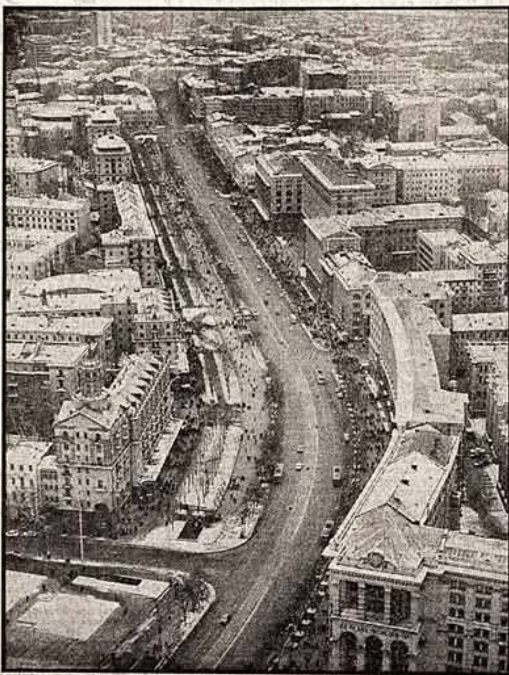
25 декабря исполняется 60 лет со дня провозглашения Советской власти на Украине. Эта знаменательная дата широко отмечается в нашей стране.

Участники пленумов в принятых постановлениях четко и полностью одобрили и приняли к руководству и неуклонному исполнению решения декабрьского Пленума ЦК КПСС, положения и выводы, содержащиеся в выступлениях товарища Л. И. Брежнева. Участники пленумов ЦК КПСС в том, что партийные организации, коммунисты, все трудящиеся, вооруженные решениями декабрьского Пленума ЦК КПСС, добьются безусловного выполнения планов 1978 года и заданий десятой пятилетки.