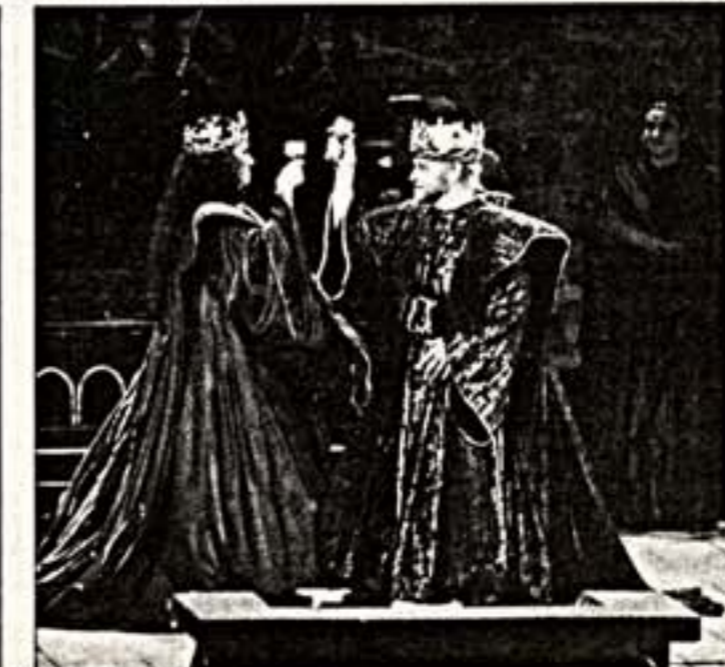
Справа: сцена из спектакля "Макбет". Й.Хюонени — Макбет, Ц.Маркс — Леди Макбет