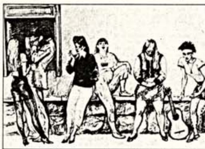
Лист из серии «Прогулки по старому Арбату»