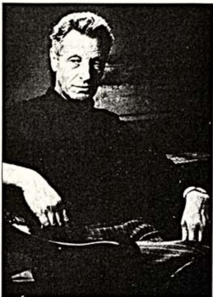
На этом фотопортрете «просто художник» В.Цигаль похож на «просто дирижера» Герберта фон Караяна