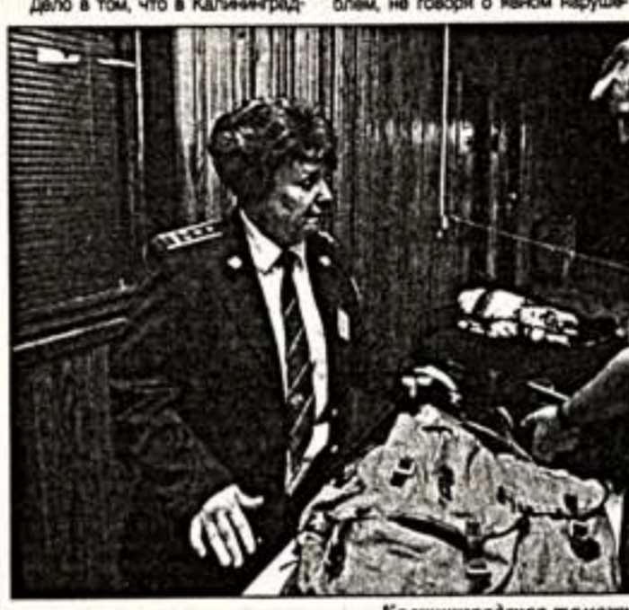
Калининградская таможенная работает в усиленном режиме

Два года назад заработала служба уполномоченного по Калининградской области, подчиняющегося территориальному управлению по сохранности культурных ценностей в Санкт-Петербурге.