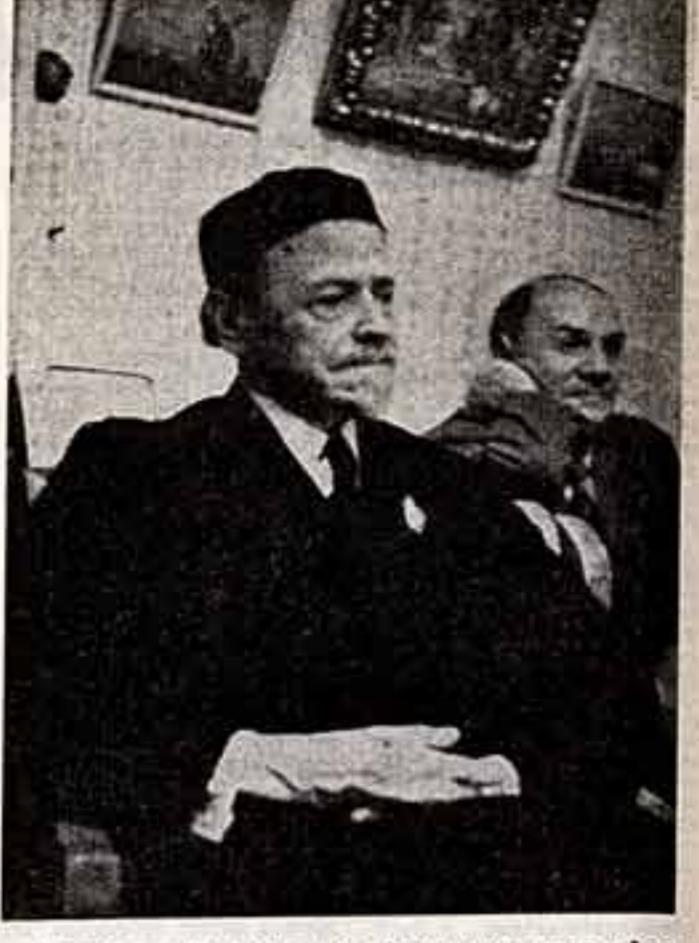
Художник М. В. Нестеров в день вручения ему ордена Трудового Красного Знамени, 1942 год.