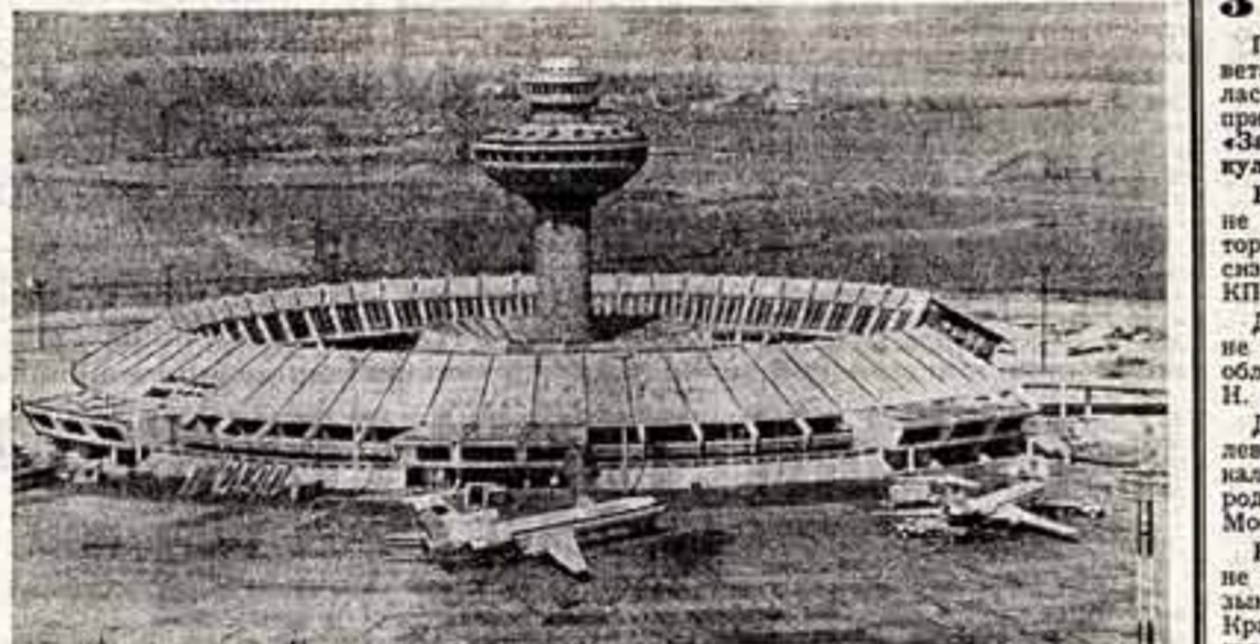
Прошло чуть больше двадцати лет с того момента, как в Ереване был построен аэропорт «Западный»...