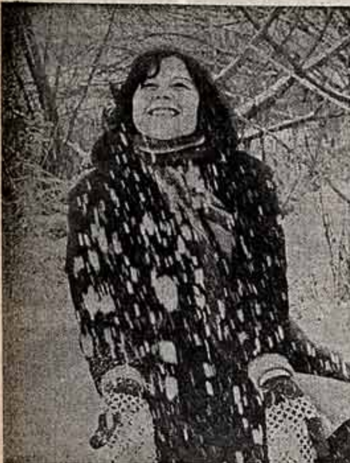
В. ШЕНТЛУСКАС. «Жизнь радостна». В. ВОЛКОВ. «Вместе — к природе».