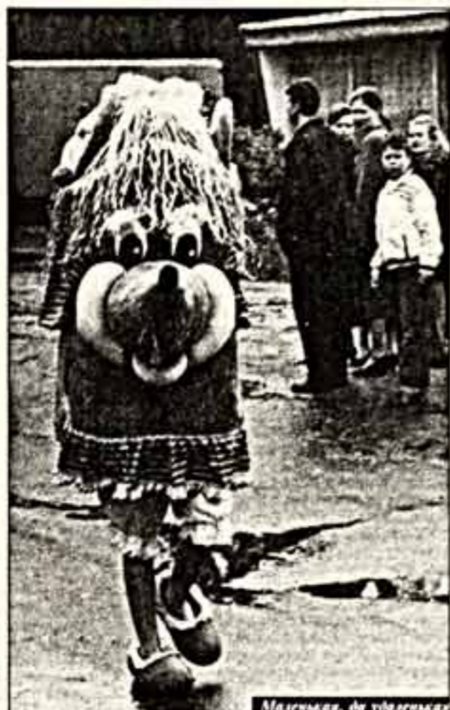
Машинка, на удивление