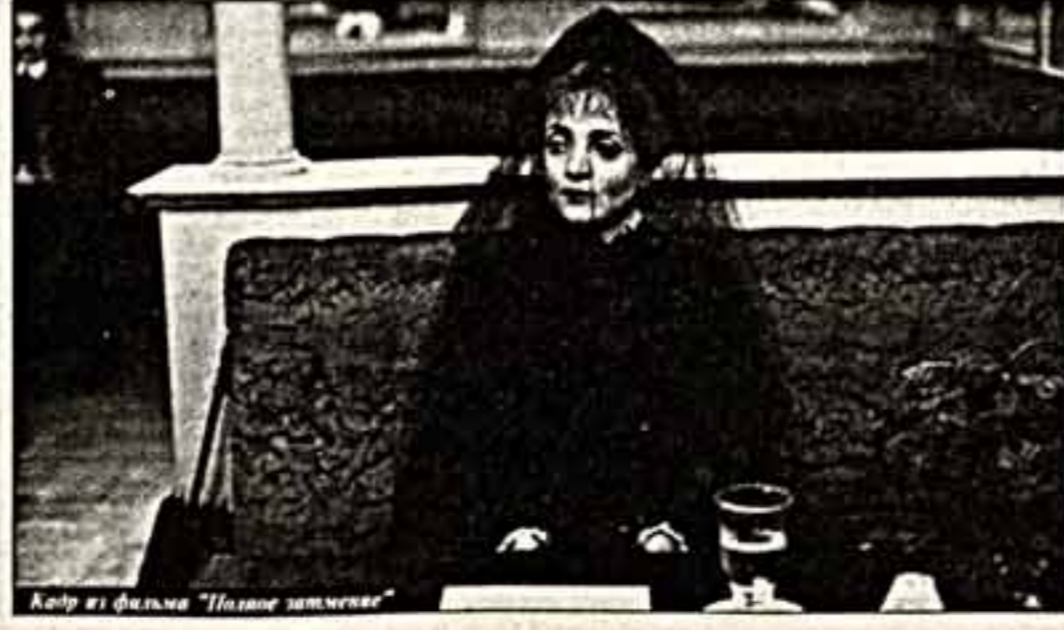
Кадр из фильма "Полное затмение"