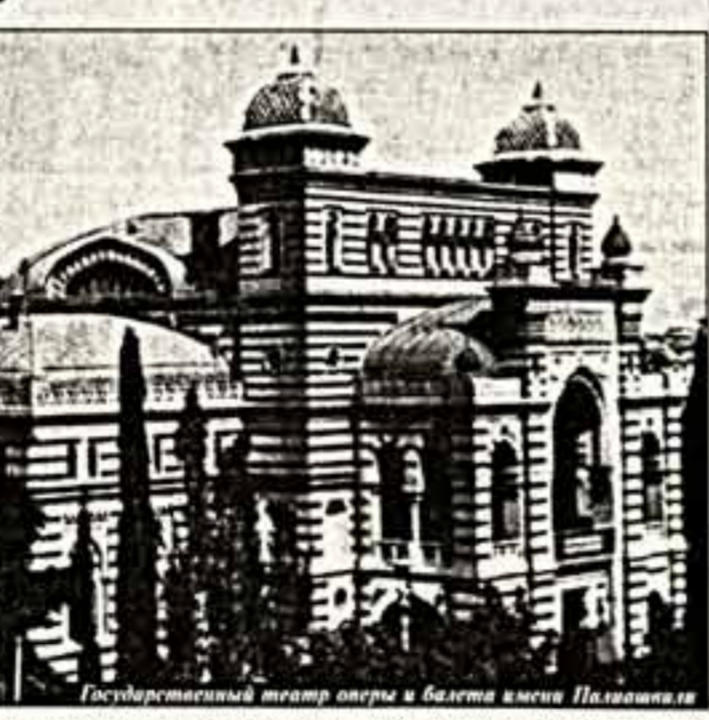
Государственный театр оперы и балета имени Пашаишвили

предложенная Гигой Лорткипанидзе, Лиге кажется вовсе не единственным путем. Реформа в грузинском театре неминуема и обязательна. Но надо выработать проект реорганизации всего театрального дела, а не двух-трех театров.