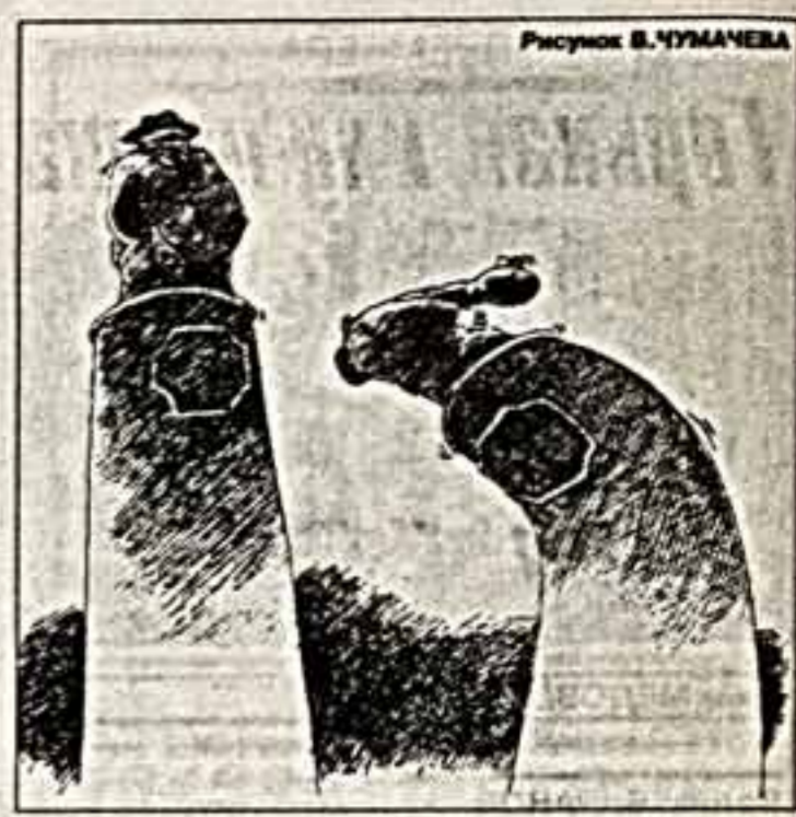
Рисунок В. ЧУМАЧЕВА

Есть в Киеве бульвар, который носит имя украинского по-