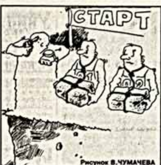
Рисунок В. ЧУМАЧЕВА

Накануне съемок очередного выпуска "Телевизионных встреч" в Москву из Томля прилетели Нани Брегадзе и Медия Гонгладзашвили.