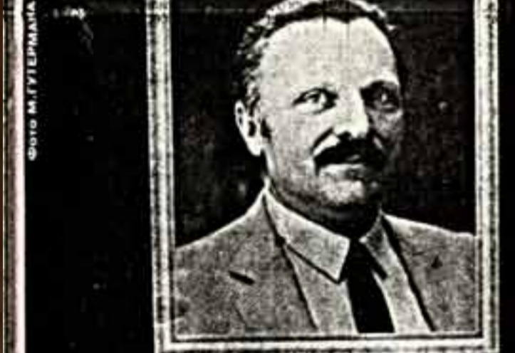
Юрмале — Юрмале

мысленно отрывающимся от шумных изданий в пользу нередко безликих и бездушиных примет западной цивилизации. "Ляля", "Ляля цветочная", "Женщина моей мечты и попугай" образовали цикл работ, выполненных в "гобеленовой" технике. Это двухслойное письмо, когда поверх живописного полотна, написанного темперой или маслом, накладываются лассировочные мазки маслом. Таким образом создается эффект "дымки", который наполняет известную всем ткань. Легко бегущая у земли женщина с подносом из трав, цветов и фруктов была в его жизни нежданной любовью, милым ангелом, символом вечной женственности. Об этом рассказывают картины нашего современника, не желающего знать о границах современного времени той, которая украсила его жизни, а он в ответ подарил нам свое творчество.