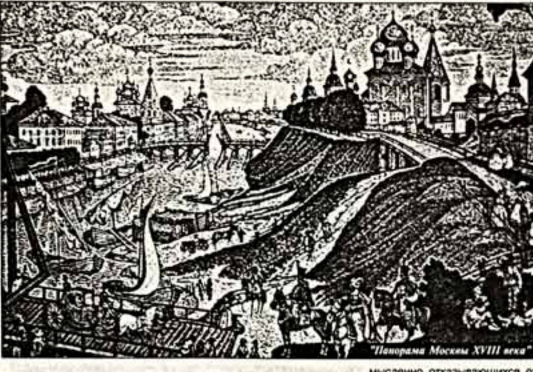
"Панорама Москвы XVIII века"