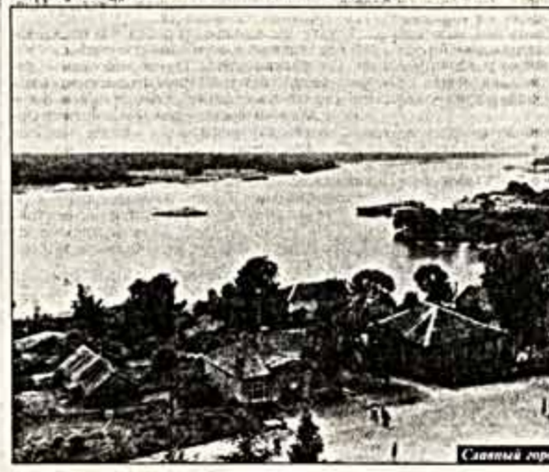
Славный город Мышкин