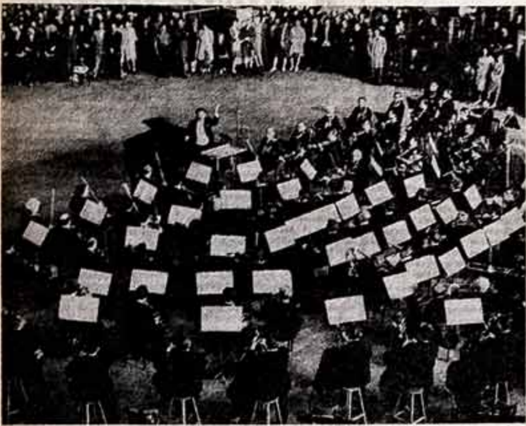
Т. ХРЕННИКОВ, народный артист СССР, Герой Социалистического Труда, лауреат Ленинской премии.

Кубассе — крупнейший промышленный центр, цитадель рабочего класса. И именно с общественной Кубассе хочется обсудить проблемы, волнующие нас в преддверии VI съезда композиторов СССР: мы со слушателями — единомышленники.