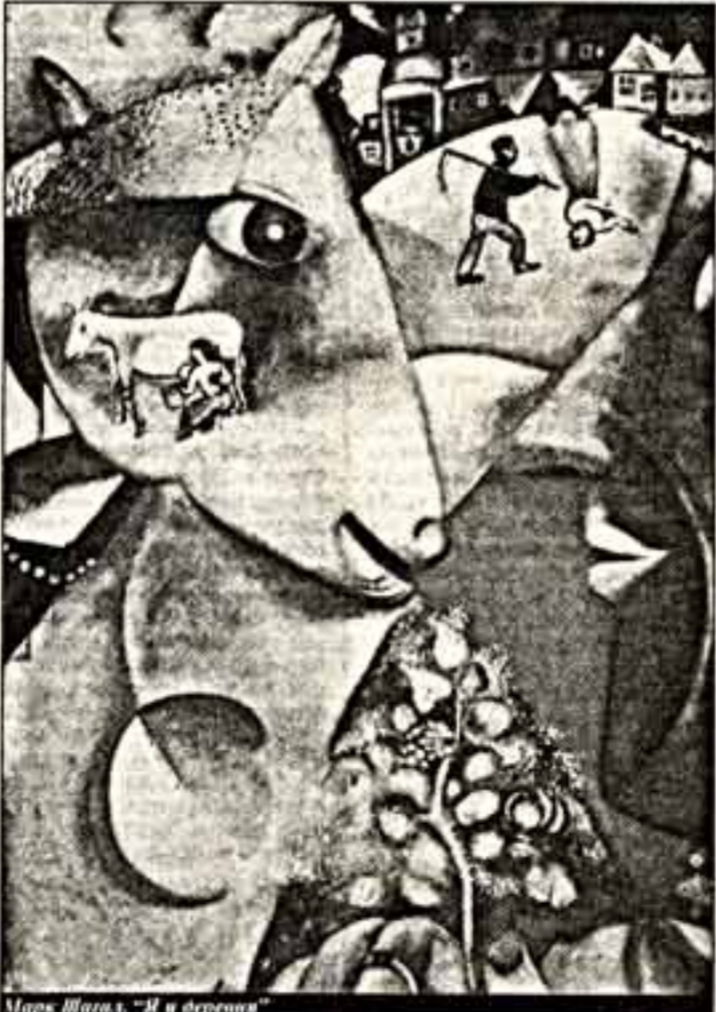
Марк Шагал. "Я в деревне"

Не только художественный обмен, но и растущая миграция являются движущей силой в отношениях между обоими городами. Даже больше, чем Париж, Берлин оказывается для России окном на Запад. Например, в 1910 году в Германии живут или выставляют свои произведения больше русских художников, чем в Париже. Уже в это время в Берлине проживают более 100.000 русских граждан, которые ищут тут лучшие условия труда и жизни или по-