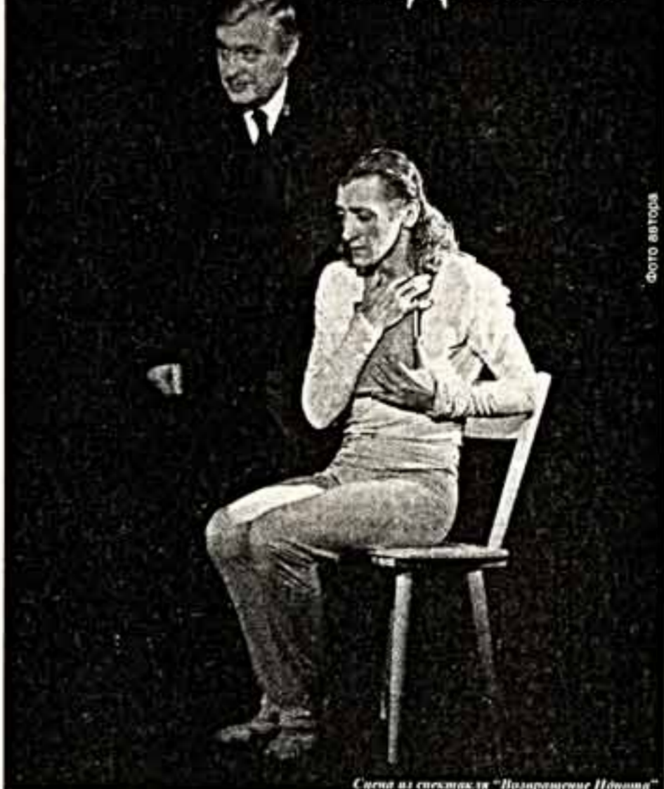
Сцена из спектакля "Возвращение Идиота"