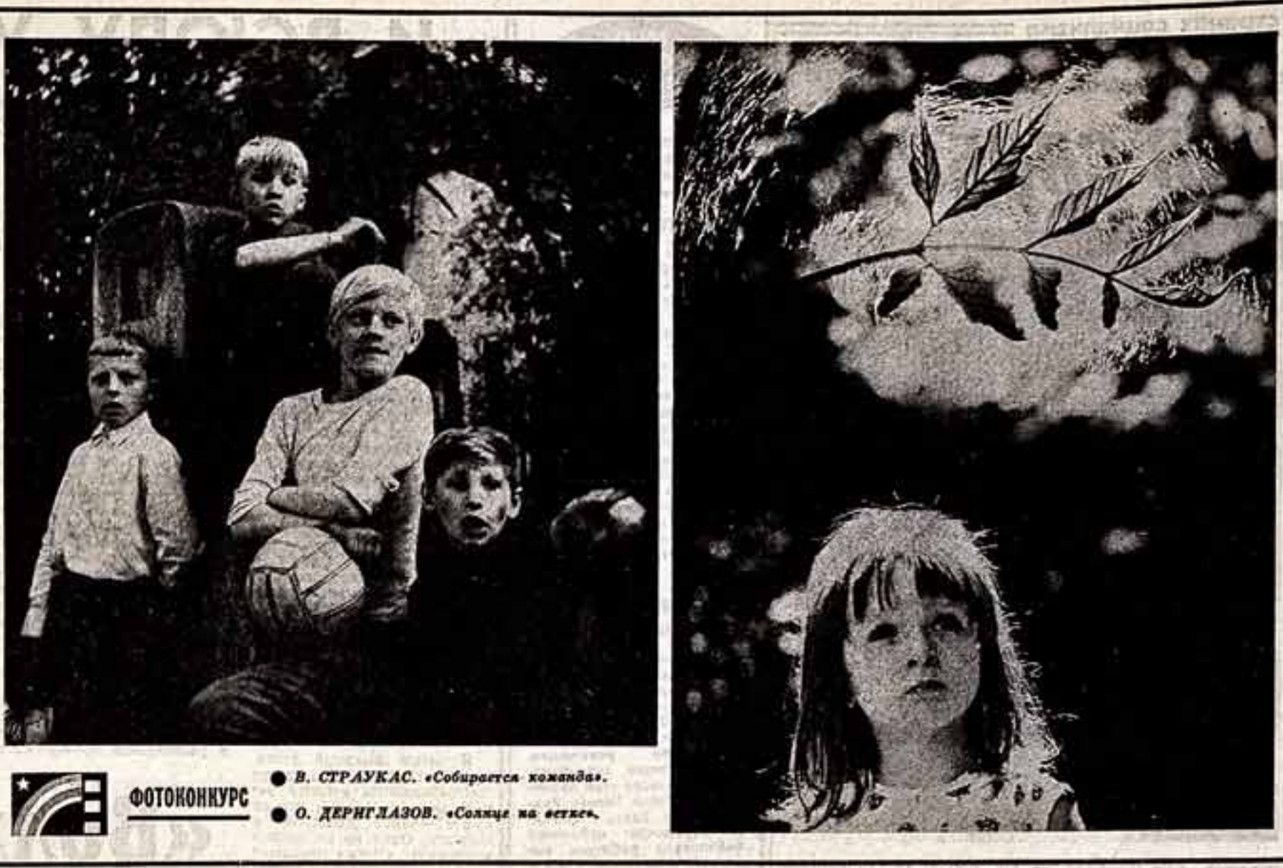
В. СТРАУКАС. «Собирается команда». О. ДЕРИГЛАЗОВ. «Солнце на ветке».

Подборка подготовлена корреспондентами ТАСС специально для «Советской культуры».