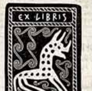
Д. ЦИЦИВИЛИ. Эксибрис Г. Ниорадзе.