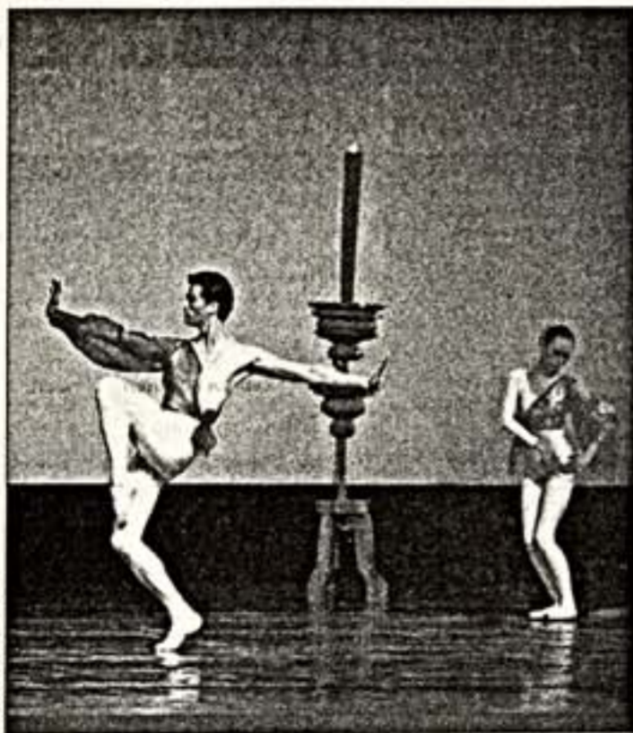
Сцена из балета "Перед свадебной палатой"