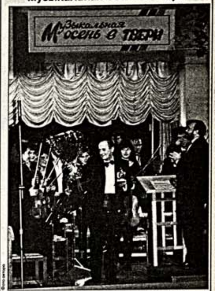
Оркестр "Молодая Россия"