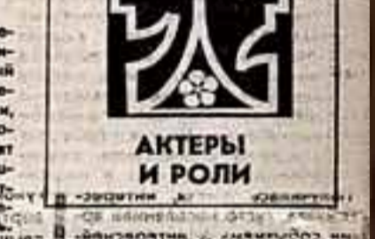
АКТЕРЫ И РОЛИ