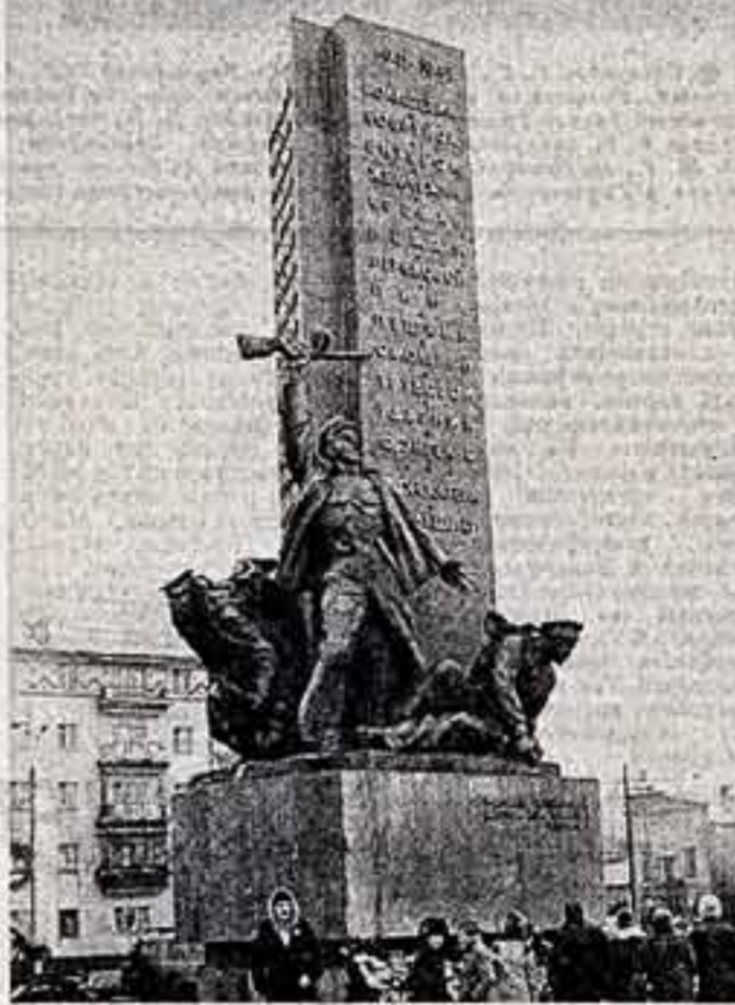
В Киеве, на берегу Днепра, открыт памятник морякам героической Днепровской военной флотилии. Автор проекта — скульпторы А. Скобликов и М. Вронский, архитектор Н. Ланько.