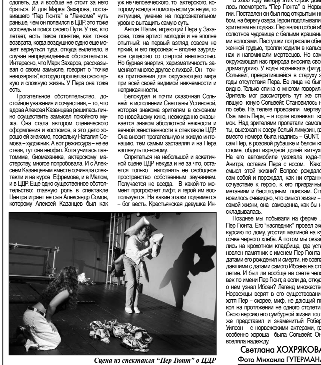
Сцена из спектакля “Пер Гюнт” в ЦДР