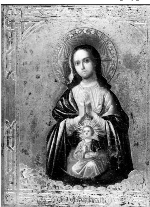
Слева: А.Постников. Икона "Богородица Помощь в родах". 1875 г. Справа: Б.Кустодеев. "Портрет Ирины Кустодеевой". 1911 г.