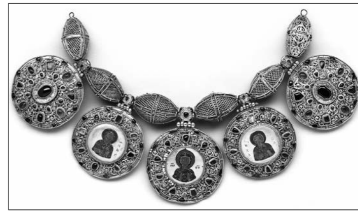
"Бармы". XII — начало XIII века. Рязань (?) Из собрания Музеев Московского Кремля

Грандиозный смотр древнерусского искусства Третьяковская галерея проводит по горячим следам российского же мегапроекта, с успехом реализованного в Париже. Выставка "Святая Русь" в Лувре стала кульминацией "перекрестного" года Франция — Россия.