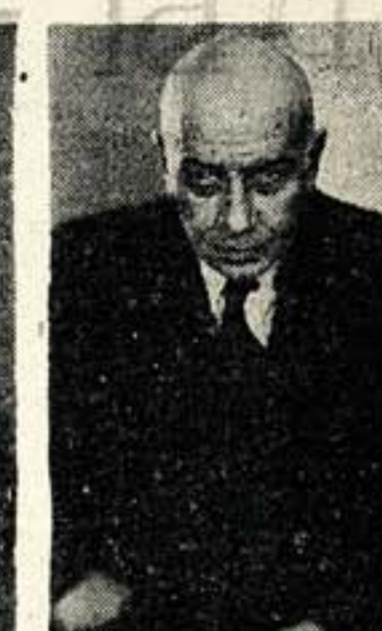
С последнего снимка