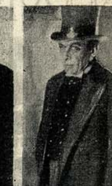
Консул Берник («Стоп! Обществу!»)