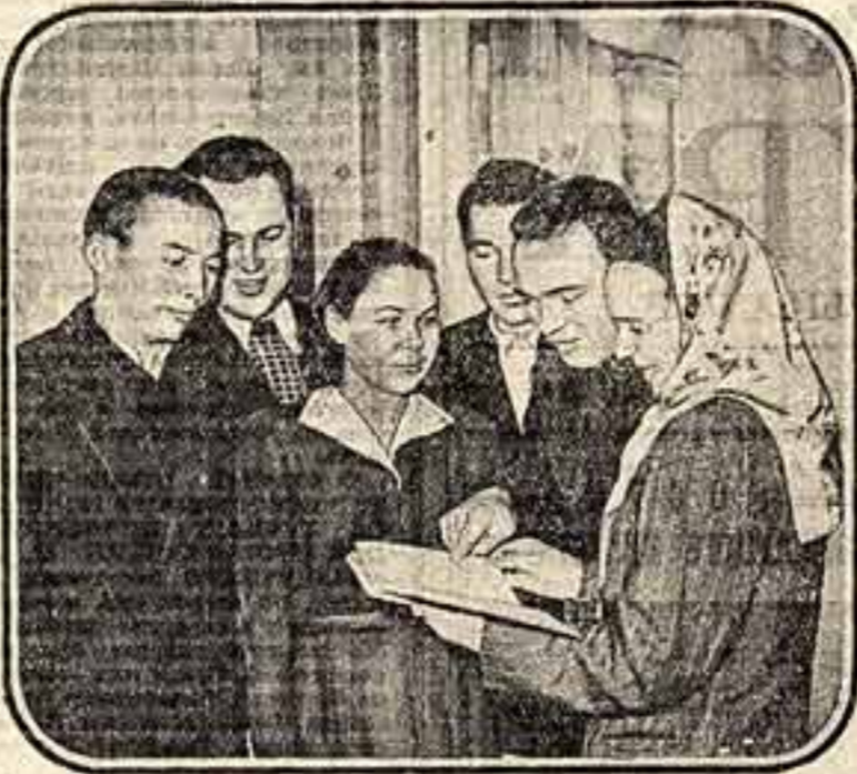
Группа киноаппаратуры — участники Всесоюзного совещания работников сельской кинесети. Слева направо: В. Сури (Министр культуры СССР), Н. Михайлов (Министр культуры РСФСР), Т. Зуева (Заместитель министра культуры СССР), А. Грошин (Министр культуры РСФСР).